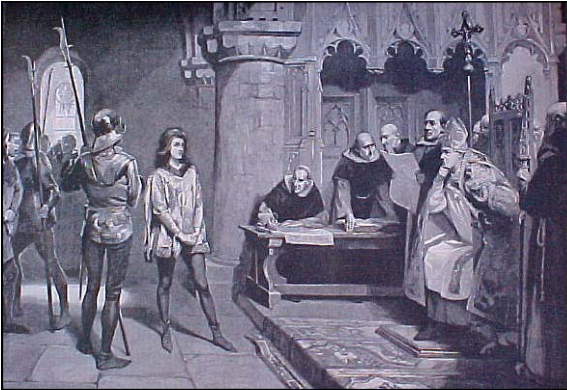
Imatge 9. Joana d'Arc compareix davant del jutge Cauchon. En el procés només es prengué nota de les declaracions que podien perjudicar-la.

Llavors els guardians la despullaren, i, per cobrir-se només li deixaren roba d'home. Quan Cauchon la veié així vestida, l'acusà de no complir el què havia promès. Les veus havien reaparegut novament, i s'utilitzaren com una prova de bruixeria. En un nou, i ràpid judici, va ser condemnada a morir cremada a la foguera.