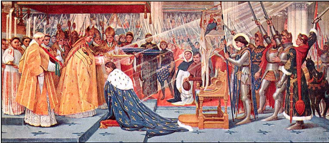
Imatge 1. Carles VII és consagrat rei de França a la catedral de Reims. Darrere seu es troben Joana d'Arc i els principals nobles del regne.

El món de l'Edat Mitjana era complicat, massa complicat, fins i tot per als seus contemporanis. El feudalisme havia substituït l'organització de l'Imperi Romà per una indesxifrable xarxa de fidelitats i lleialtats personals. Tots els nobles, i també alguns reis, eren vassalls d'altri. Per damunt, obeïen un superior; per sota, posseïen territoris on actuaven amb total independència.