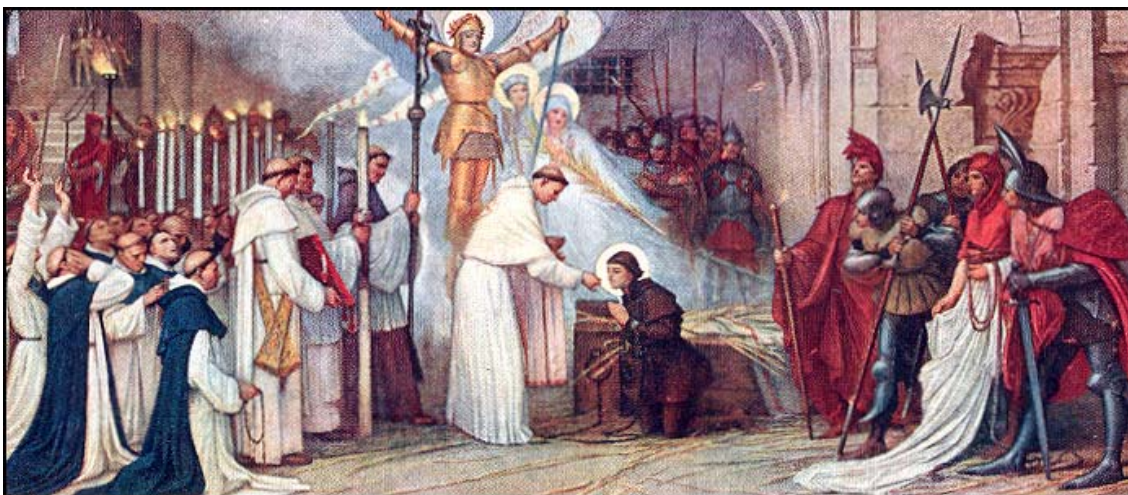
Imatge 10. La darrera comunió de Joana d'Arc. En els seus darrers dies les veus l'ordenaren acceptà el seu destí i preparar-se per morir cristianament.