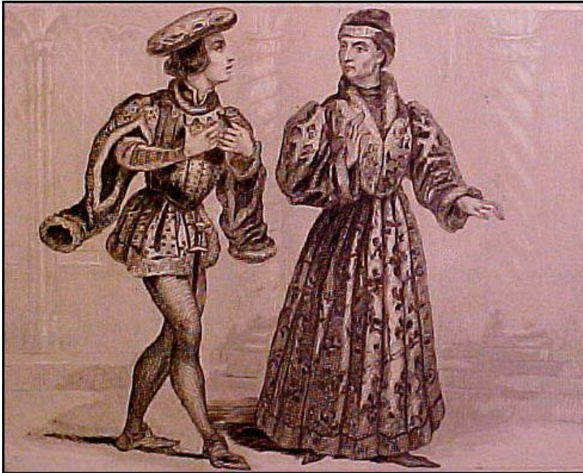
Imatge 4. Joan Sense Por ( a la dreta ), amb un membre de la Cort.

El ducat de Borgonya era un estat molt poderós. Inclouïa els territoris de les actuals Bèlgica, Holanda, així com el Nord i l'Est de França,