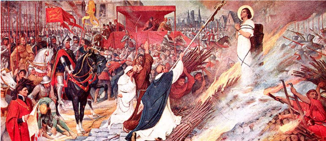
Imatge 11. Joana d'Arc a la foguera. Els soldats borratxos atacaren el públic, creant tal desordre que el jutges, carregats de por, es veieren obligats a abandonar l'estrada.

Fora de la ciutat, un grup de genets contemplava com l'espèss fum de la foguera omplia l'aire. Es tractava de Gilles de Rais i els seus homes. Irritat per la passivitat del rei, s'havia discutit amb ell. Després, havia decidit dirigir-se a Rouen per alliberar Joana amb un atac per sorpresa. Havien arribat una hora tard. Desencantats, donaren mitja volta abans no els descobrissin.