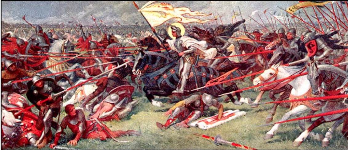
Imatge 7. Batalla de Patay. Joana d'Arc, portant l'estendard, ataca l'enemic.

El 17 de juliol, Carles VII va ser consagrat rei de França a Reims, en presència dels principals nobles i eclesiàtics del país. Joana assistí a l'acte portant l'estendard de guerra. Havia de ser el moment del triomf, però, en realitat, va ser l'inici de la seva caiguda.