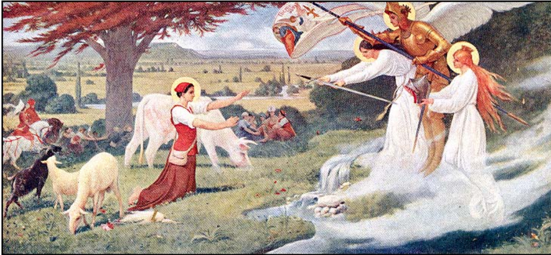
Imatge 6. Les veus s'apareixen a Joana d'Arc. Sant Miquel Arcàngel adoptava la forma d'un jove amb armadura resplendent. Santa Caterina i Santa Margarida vestien túniques d'un blanc immaculat. L'arcàngel porta l'estendard que després Joana adoptaria com distintiu personal.

reial, el monarca, vestit amb senzillesa, s'havia barrejat amb els cortesans. No obstant, Joana – que no l'havia vist mai – es dirigí a ell. Després, li confià un secret que només Carles VII coneixia.