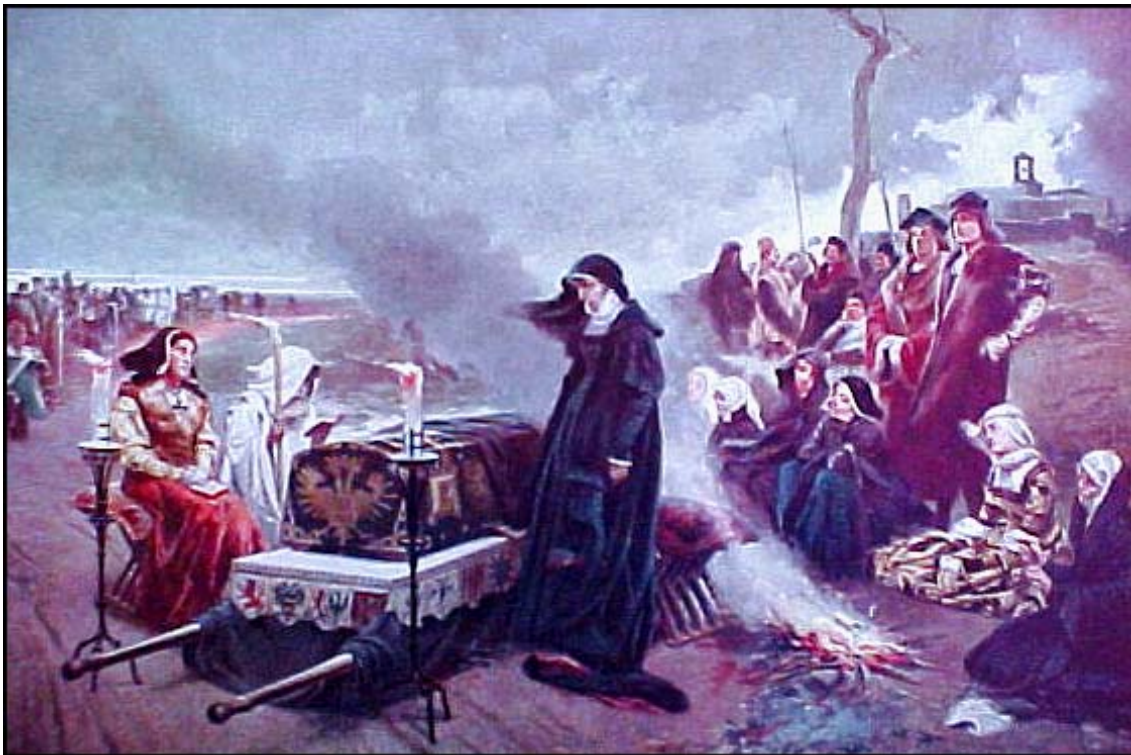
Imatge 12. La reina Joana contempla el taüt de Felip. L'obra representa la matinada de la nit que descobrí que havien de pernoctar en un convent de monges. Pot observar-se la fatiga dels cortesans.

Tot i ser de nit, va fer obrir la caixa del mort. Els cortesans hagueren de comprovar una altra vegada si el cos era efectivament el de Felip.