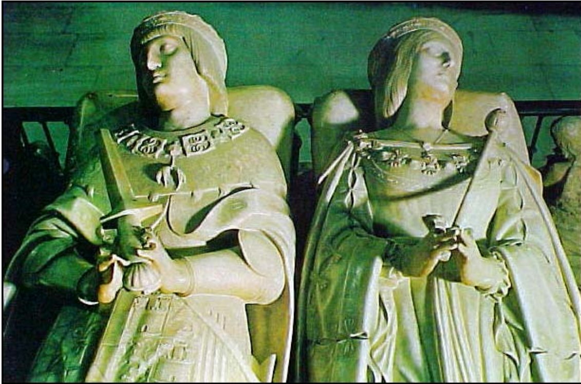
Imatge 14. Escultures sepulcral de Joana la Boja i Felip el Bell.

Per ordre del rei Carles, els cossos de Joana i de Felip es transportaren a la catedral de Granada, on es dipositaren en un sepulcre situat al costat del dels Reis Catòlics. I des de llavors fins el nostres dies han estat junts, tal com Joana sempre havia desitjat.