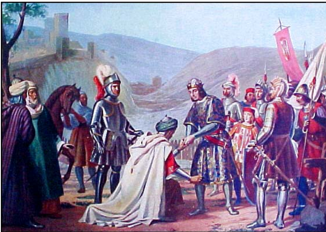
Imatge 2. Rendició de la ciutat de Loja a Ferran el Catòlic.

Amb el restabliment de l'ordre, el Reis Catòlics emprengueren la conquesta del regne de Granada, l'últim estat islàmic d'Espanya. La guerra començà el 1481 i durà deu anys. Els cristians es veieren beneficiats per una guerra civil que esclatà entre el rei moro Boabdil i el seu oncle El-Zagal. Poc a poc, les ciutats del regne, com Màlaga o Loja, caigueren en poder de Castella. La capital, Granada, després d'un llarg setge, s'acabà rendint als Reis Catòlics el 2 de gener de 1492.