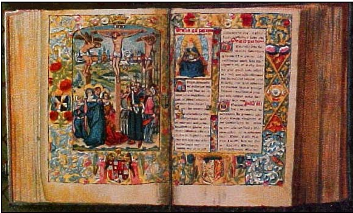
Imatge 1. Bíblia d'Isabel la Catòlica.

A mitjans del segle XVI, vivia a Tordesillas, prop de Valladolid, una estranya presonera. Tancada en el palau, se la sentia cridar des de les finestres quan, l'abrasadora calor de l'estiu obligava a obrir els porticons. Demanava pel seu marit, per les seves filles. Plorava i llençava commovedors esgarips. Ningú no s'atrevia a fer-la callar, perquè aquella dona vella, clarament pertorbada, era encara – si més no de nom – reina de Castella i d'Aragó, de Nàpols i Sicília. La reina Joana. Joana la Boja.