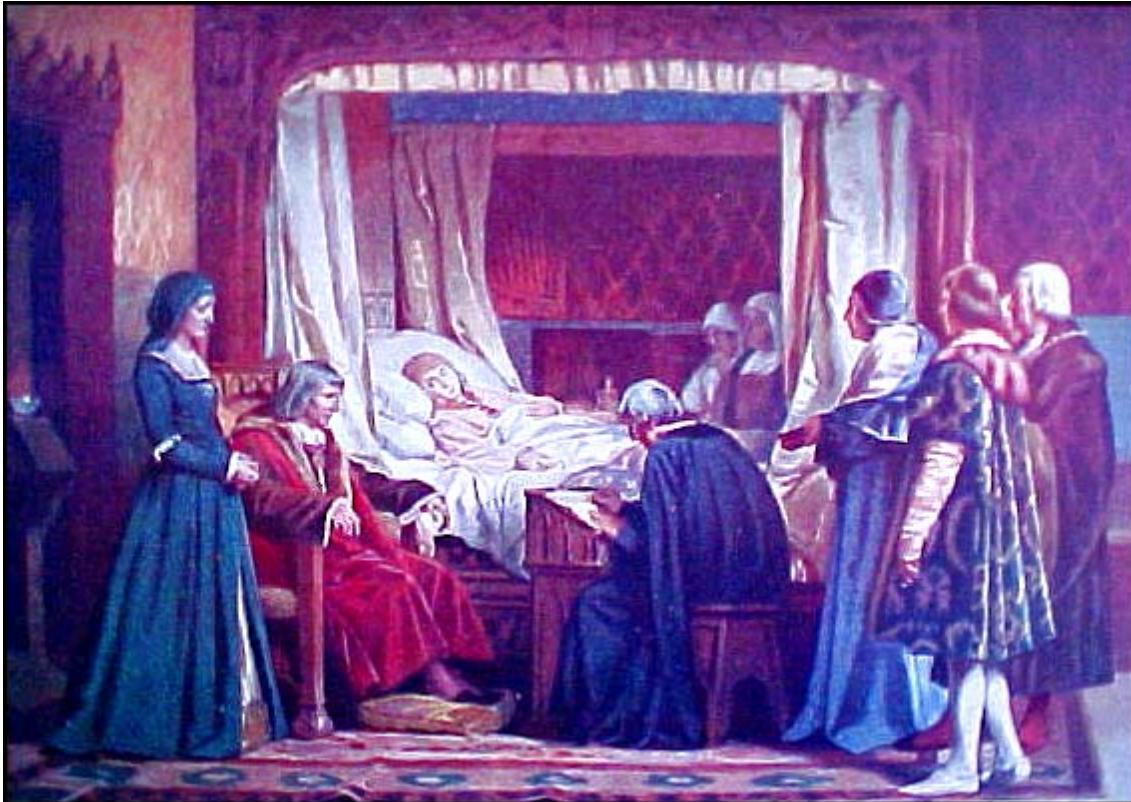
Imatge 5. El testament d'Isabel la Catòlica. La reina dictà les darreres voluntats al Protonotari de Castella, en presència dels principals nobles del regne i de Ferran, assegut al costat de la capçalera del llit.