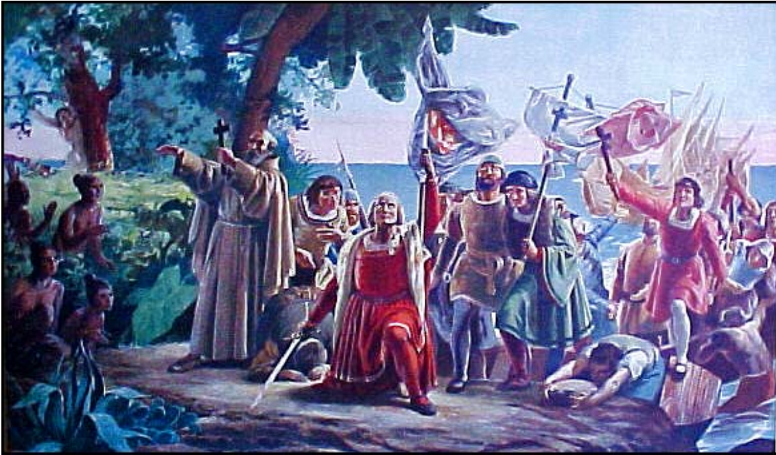
Imatge 4. Colom desembarcant a Amèrica. Malgrat la creença popular, reflectida també en aquesta obra ( i en gairebé totes les versions del descobriment ), en la tripulació del primer viatge de Colom no hi figurava cap sacerdot.

En política exterior, el regnat dels Reis Catòlic es caracteritzà per l'enemistat amb França. El 1494 el rei francès Carles VIII invaí Itàlia per apoderar-se de Nàpols. Ferran organitzà una coalició amb el Papat, la República de Venècia, el ducat de Milà i l'emperador Maximilià d' Àustria. El monarca francès hagué de retirar-se, però el seu successor, Lluís XII, tornà a intentar ocupar Nàpols l'any 1500. Obtingué alguns èxits inicials, però Ferran envià contra ell un exèrcit, manat per Gonzalo Fernàndez de Córdoba, el Gran Capitán , que el derrotà completament a la batalla de Serinyola. L'octubre de 1503, pel tractat de Blois, Lluís XII reconeixia Ferran com a rei de Nàpols.