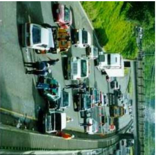
El carnet per punts vol evitar l'alta sinistralitat.

Això vol dir que els conductors, que disposaran d'un crèdit inicial de 12 punts, podran perdre el carnet en un sol dia per l'acumulació de dues de les infraccions molt greus sancionades amb la pèrdua de 6 punts cadascuna. Així ho va afirmar ahir el ministre d'Interior, José Antonio Alonso , després de la reunió del Consell de Ministres. Podrà succeir així en els casos en els quals, per exemple, una persona conduïx amb un grau elevat d'alcoholèmia i que sigui denunciada per conducció temerària. Convé assenyalar que la pèrdua no es produirà de manera immediata, ja que