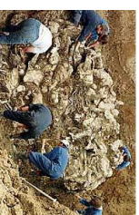
Desenterrant fossos comuns.

Així i tot, els principals responsables, l'expresident de la República Srpaska, Radovan Karadzic i el comandant serbi Ratko Mladic , segueixen sense aparèixer, suposadament protegits per la població sèrbia i per part de l'exèrcit i de la policia de la veïna Sèrbia. La població no sèrbia de Bòsnia està de convinguda que les forces internacionals no tenen cap interès a localitzar-los.