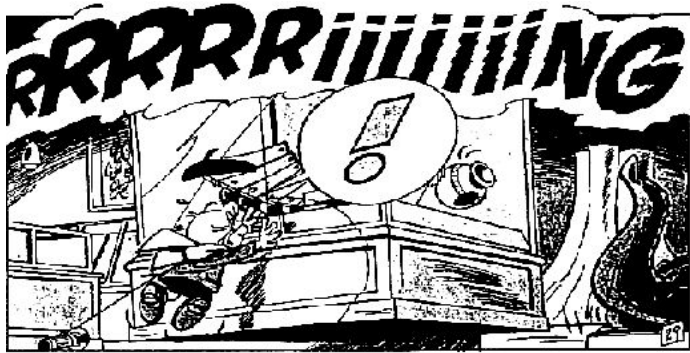
© Peyo. Les aventures de Benet Tallaferro. (versió d'Albert Jané).