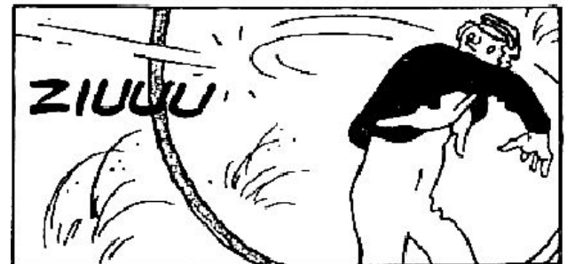
© Madorell. Les aventures encara més extraordinàries d'en Massagan. © Franquin. Sergi Grapes.