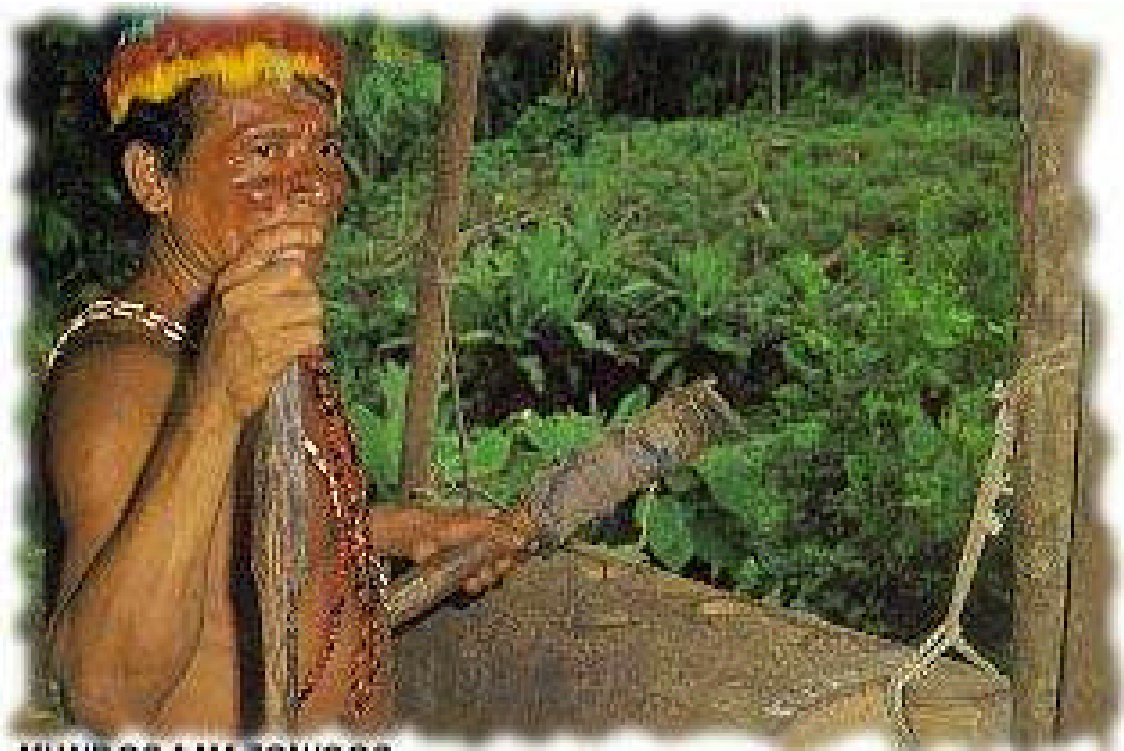
MUNDOS AMAZONICOS Fundación SINCHI SACHA