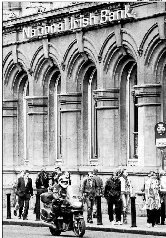
El Banc Nacional Irlandès, en una imatge del 2007

blc incrementa la prima de risc. Això significa que Irlanda haurà de pagar un interès superior pels diners que necessita i demana en els mercats. L'interès de les obligacions públiques irlandeses és superior al 8%, mentre que l'interès de les obligacions d'Alemanya és del 2%. Aquest diferencial del 6% és la prima de risc que té invertir en un estat com Irlanda, que pot deixar de pagar les seves obligacions o declarar-se en fallida. Els elevats interessos del deute públic irlandès augmenten les despeses financeres que s'han de pagar, cosa