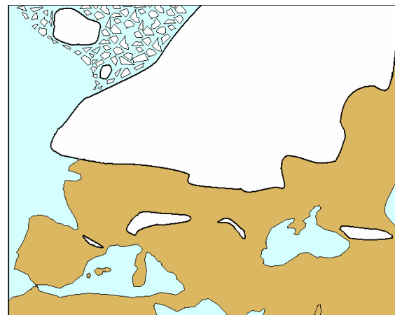
EUROPA EN EL MÀXIM DE LES GLACIACIONS QUATERNÀRIES

Fa tan sols uns 10.000 anys el clima era molt més fred que ara. Observa l'extensió del casquet de gel del nord d'Europa durant les glaciacions i els canvis en la línia de costa, a causa de la baixada del nivell del mar.