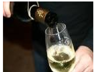
EL VI BLANC ÉS EL MÉS