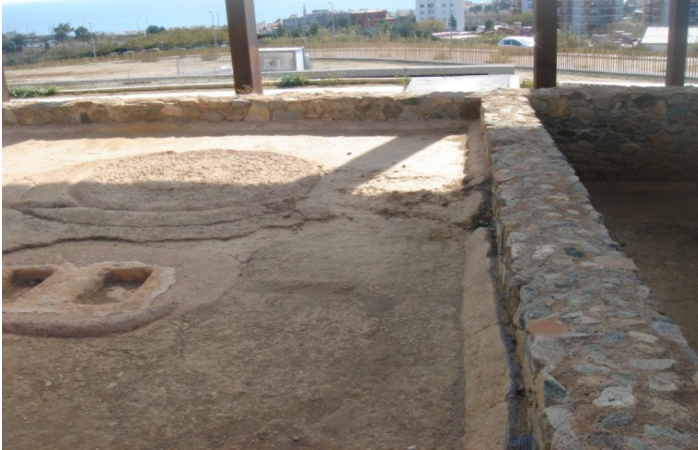
RESTES ARQUEOLÒGQUES D'UN CELLER ROMÀ

L'agricultura d'Alella es basa en la producció vinícola. Hi ha una important producció de vi, principalment blanc, amb denominació pròpia (D.O.Alella). El vi d'Alella és famós des del temps dels romans, fa més o menys 2000 anys.