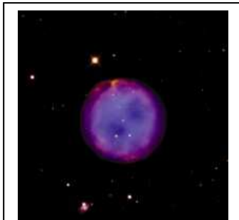
M97 – NGC 3587 Nebulosa del Mussol