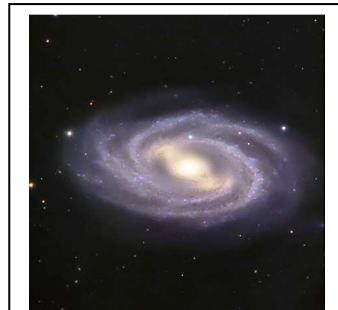
M109 – NGC 3992 Galàxia espiral barrada