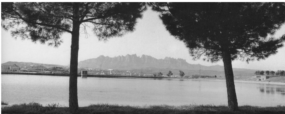
Llac de l'Agulla