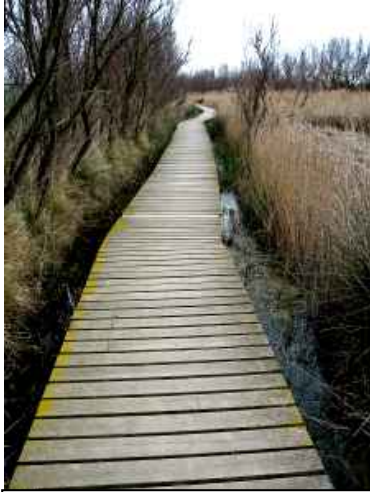
Passallís entre canyís i tamaris

Aguait del Gall Marí. El nom “gall marí” és la manera local de designar la polla blava. En trobar-se entre els estanys del Matà (aigua dolça) i la Massona (aigua salabrosa), aquí podem observar-ne les principals diferències entre els dos ecosistemes, tant pel que fa a espècies animals com vegetals.