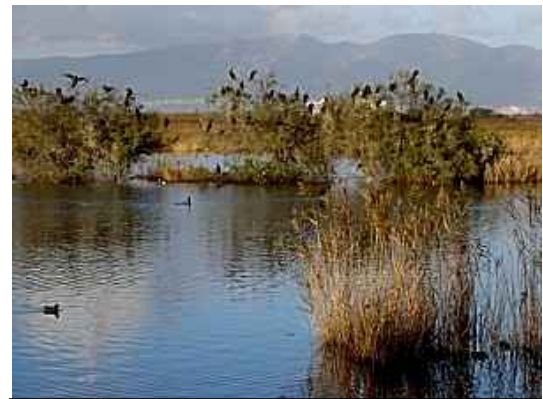
Dormidor de corbs marins al Buel

anàtids, fotges, potser cabussons emplomallats, blauets... No serà estrany que veiem saltar llisses o volar alguna rapinyaire.