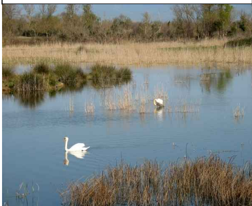
Parella de cignes muts a la closa del Puig

Observatori Senillosa. Des del cim es pot aconseguir una visió general de la zona i del que l'envolta. Es fa una lectura de paisatge aprofitant el perfil que el PN hi ha col·locat. També es parla de les closes (camps de conreu o de pastura fets a partir del s XVII, i que han acabat integrant-se en el paisatge i en els ecosistemes de la zona). Ja que l'observatori es troba en un antic eixugador d'arròs es parla també d'aquest conreu tan lligat als aiguamolls en general. A la zona de les sitges també es fa una lectura meteorològica.