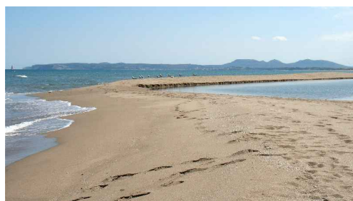
Gola del Fluvià, amb el Montgrí de fons

Arribats a la platja veurem algunes espècies més destacades de vegetació psamòfila (adaptada a viure en substrats sorrencs, com ara jull de platja, rave de mar, topacà, borró, etc.), i mirarem si observem ocells marins. Serà un bon moment per tornar a prendre dades meteorològiques tot comentant l'estat del mar i si es veuen restes de llevantades o de tramuntanades recents.