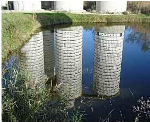
Les sitges reflectides als estanys del Matà

Els punts concrets habituals d'observació són: