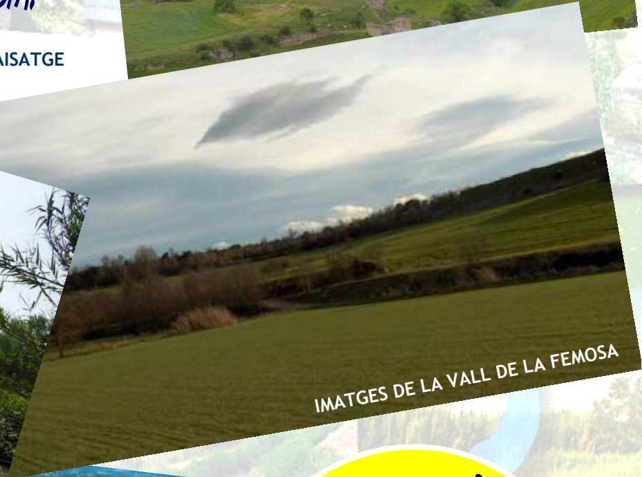
IMATGES DE LA VALL DE LA FEMOSA