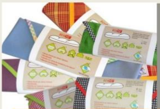
TOVALLONS DE TELA I PLÀSTIC

NO PORTIS ALUMINI AL CENTRE, POTS PORTAR EL TEU MENJAR EN: