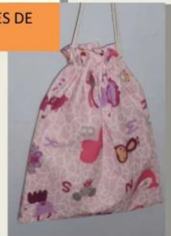
BOSES DE TELA