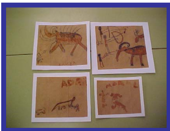
Dibuixos fets entre les sessions 3 i 4

Vam veure el vídeo "L'home de Cromanyó" de la col·lecció Les tres bessones. Vam continuar el dibuix del dia anterior. Ho vam resseguir bé amb carbó i ho vam pintar amb colorant fet d'argila. I al final ho vam envernissar.