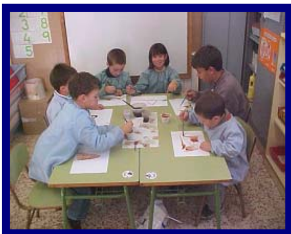
Provant els colorants naturals

Després, tots els nens vam portar productes: móres, pastanaga, carbó, molsa, fulles i argila per fer colorants naturals: Vam posar els productes i els vam aixafar amb els morters de fusta, vam anar afegint aigua poc a poc i ho vam remenar bé i anàvem traient la capa de sobre per ficar-la en gots, i ja vam tenir la pintura a punt. Per provar-ho, vam fer ratlles de colors i sanefes.