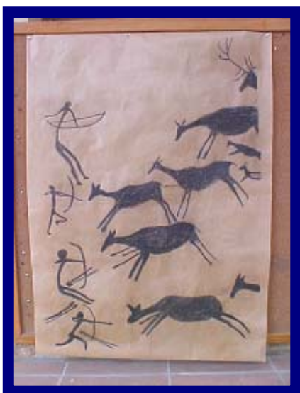
Reproducció amb carbó d'una escena de caça.

Primer vam veure una part més del vídeo "l'home". Després, amb una diapositiva vam projectar sobre un mural de paper marro una escena de caça de la cova de Valltorta de Castelló de la Plana. Ens vam posar a davant del projectador i ho vam repassar amb carbó vegetal. Quan va estar acabat ho vam envernissar.