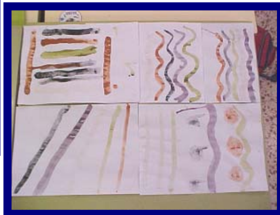
Proves fetes amb colorants naturals

Després, tots els nens vam portar productes: móres, pastanaga, carbó, molsa, fulles i argila per fer colorants naturals: Vam posar els productes i els vam aixafar amb els morters de fusta, vam anar afegint aigua poc a poc i ho vam remenar bé i anàvem traient la capa de sobre per ficar-la en gots, i ja vam tenir la pintura a punt. Per provar-ho, vam fer ratlles de colors i sanefes.