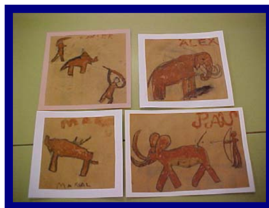
Dibuixos fets entre les sessions 3 i 4

Primer vam continuar veient el vídeo "l'home". Després vam començar a fer pintures rupestres a sobre de paper marró. Amb carbó vam dibuixar animals i persones caçant.