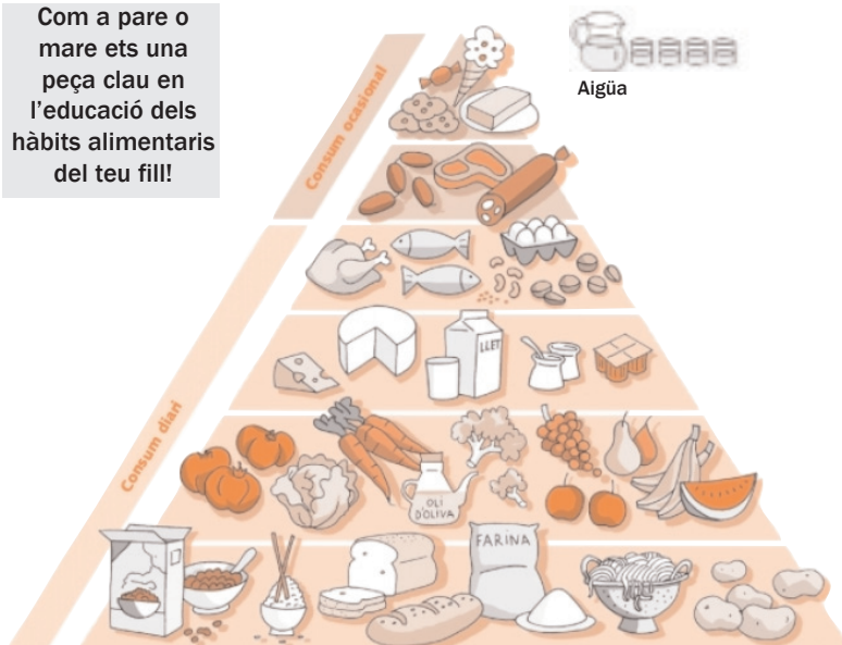
Piramide d'alimentació saludable.

Com a pare o mare ets una peça clau en l'educació dels hàbits alimentaris del teu fill!