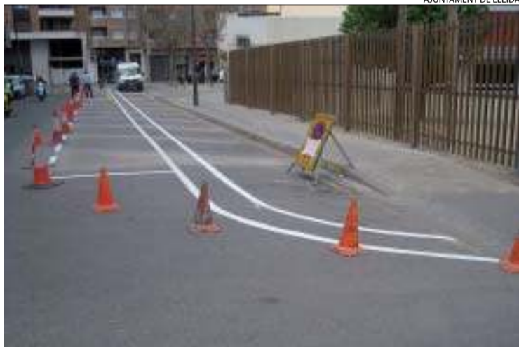
La senyalització del nou carril bici del carrer Santa Cecília.