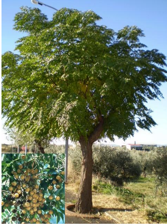
Mèlia (C. Superior)