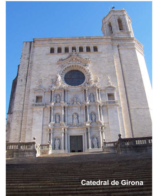
Catedral de Girona

Dimecres 25, dijous 26 i divendres 27 de febrer