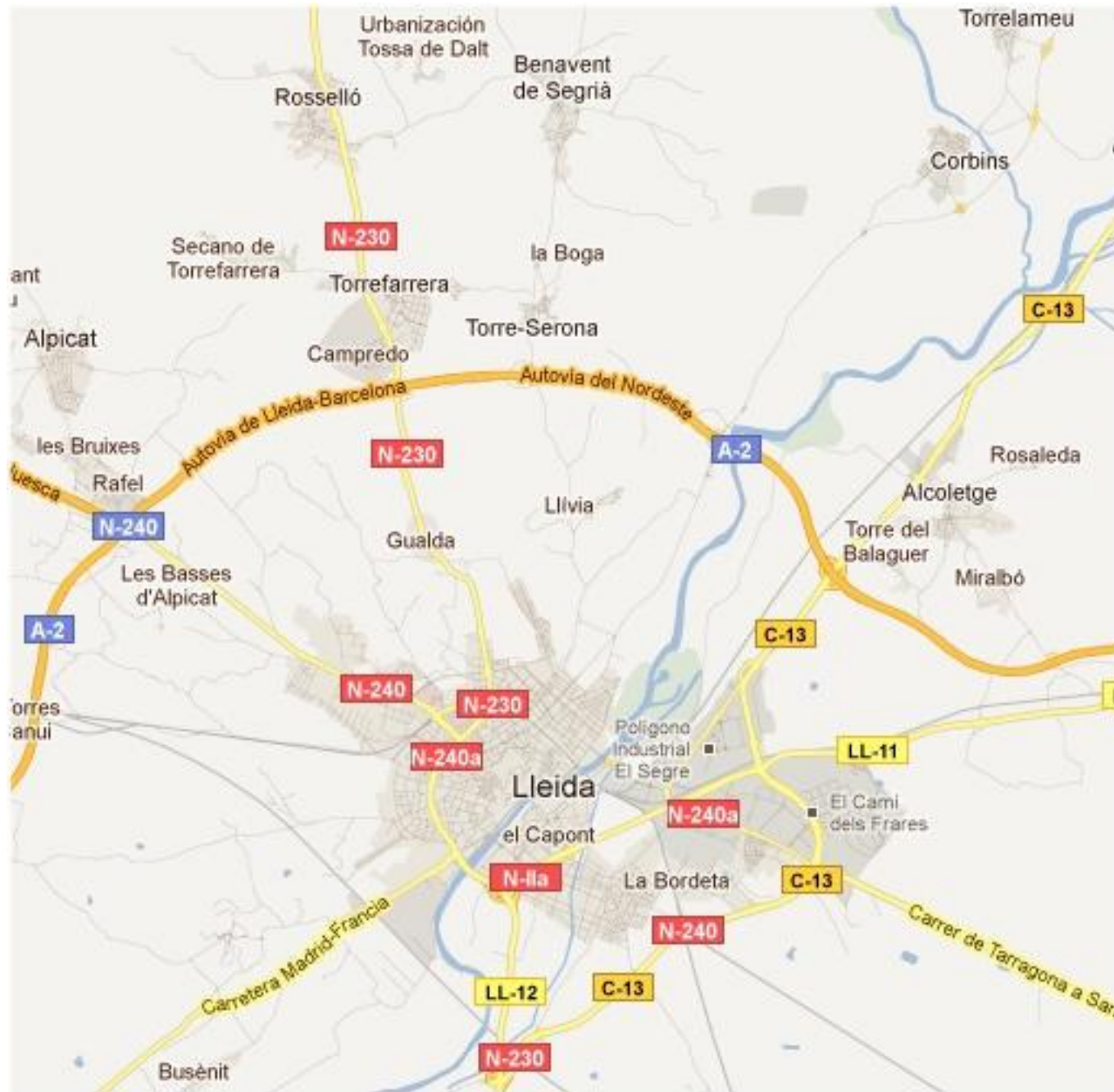
Estudi del paisatge del nostre entorn (ESC La Creu, Torrefarrera, curs 11-12)