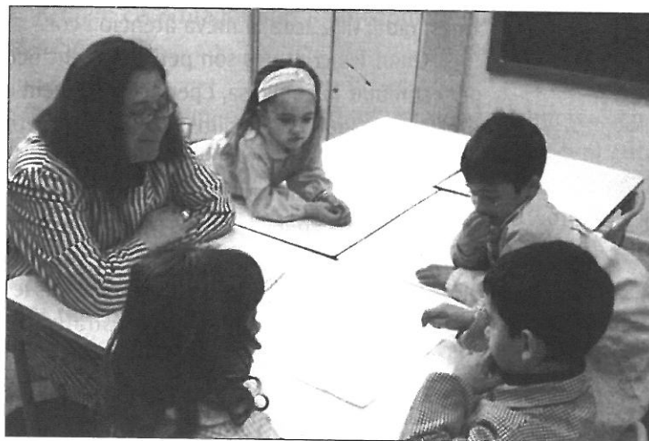
Imatge 1. Sessió d' Escolta'm amb nens i nenes de P-5 de l'Escola La Jota de Badia del Vallès

Ara, amb aquest espai, en el qual podem mantenir un contacte proper i personal amb els infants un cop a la setmana en grups molt reduïts de dos o tres alumnes, o també individualment, podem donar el suport i l'atenció que sempre hem volgut oferir. La classe petita ha de ser un espai tan aco-