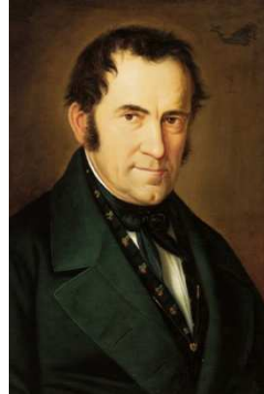
Franz Xaver Gruber

La cançó “Santa nit” va ser cantada per primera vegada el 24 de desembre de 1818 a prop de Salzburg. El cantant va ser acompanyat per una guitarra.