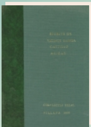
Escrits de Vicente García Castillo, Acigar Col·lectiu Ullal, 2000