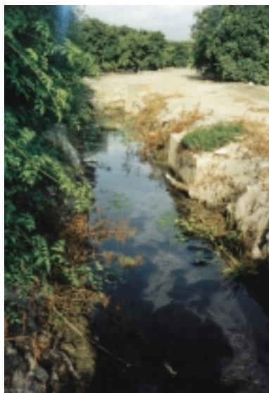
Ullal de la Casa del Governador.

Al terme de Sollana hi ha espais naturals propis com els ullals sobre els quals no s'està fent res, desatesos per la regidoria corresponent i que si no s'actua prompte sobre ells acabaran aterrats, quedant reduïts només a un record en la memòria dels més majors.