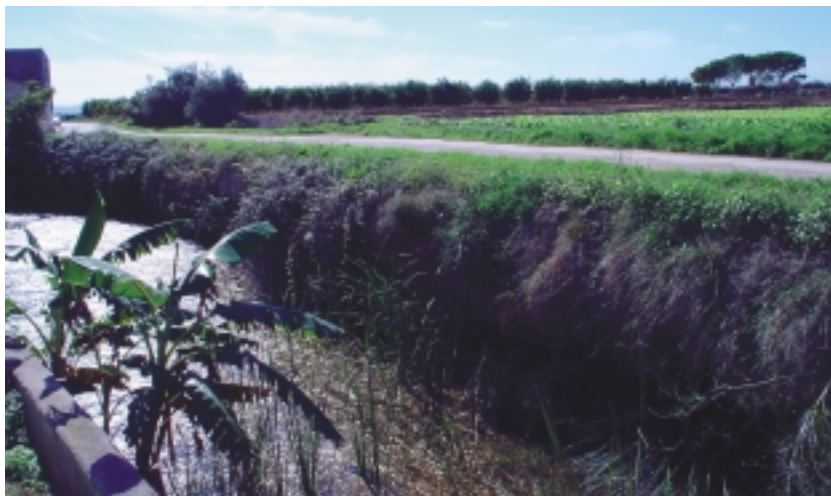
Ullal del Rejolar o del Romani. Al fons a la dreta, l'Alcaissia.

L'ullal naix en un desnivell topogràfic d'aproximadament tres metres i és un dels que presenta més cabdal d'aigua, mig metre, més o menys, la qual cosa està en funció del regim estacional i pluvial. Té diverses eixides d'aigua.