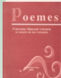
POEMES de Francesc Manuel Llorens el mestre de les Llometes Ullal 2002