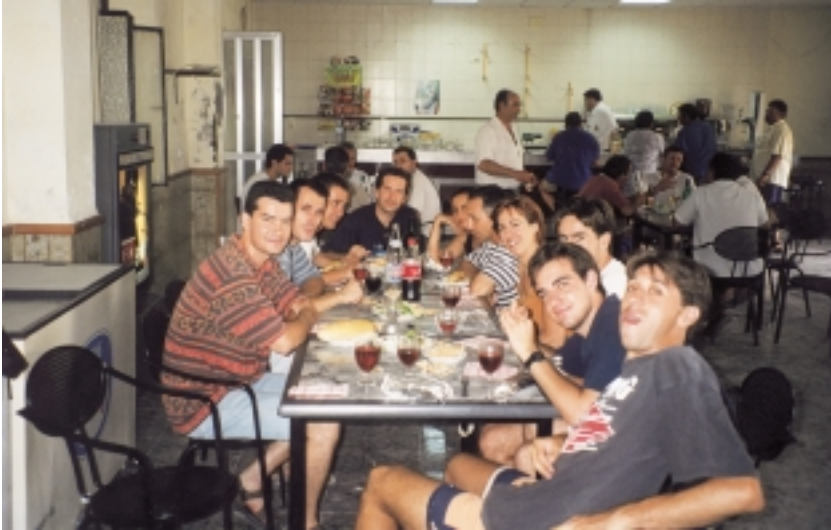
Una paradeta en el camí. Esmorzant al Casino del Romaní.

al terme d'ací uns quants anys. Per diversos motius i amb interessos econòmics pel mig, podrien ser aterrats sense cap contemplació un a un si no es posa remei ben prompte i seria una vertadera llàstima. La realitat és que molts no apareixen als plànols que disposem al nostre municipi, altres no estan catalogats i essent la seua propietat privada, dificultaria en la majoria dels casos les gestions per designar-los com a zona natural d'especial protecció.