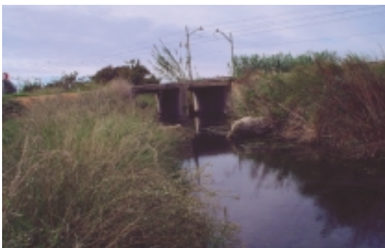
Ullal Font del Forner.

sobre ell. En temps recents, havia acabat convertint-se en un abocador incontrolat amb gran quantitats de deixalles i escombraries que l'enlletgien enormement. Podem comprovar també que el terreny annex ha estat abandonat repetint-se la situació que hem vist en anteriors