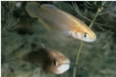
Samarucs (Valencia hispanica).

samaruc s'han fet intents per introduir novament el samaruc en les llacunes valencianes, com la reserva d'Algemesí, però és molt difícil perquè es moren molt prompte. Malgrat açò s'ha aconseguit que en alguns ullals s'estabilitzen les poblacions de samaruc. També cal remarcar que a la Font del Barret i altres ullals del nostre municipi l'any 1995 s'hi dipositaren 150 samarucs.