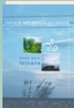
Col·lecció Itineraris III RUTA PELS ULLALS Llorenç Benaches Borràs Ullal 2003