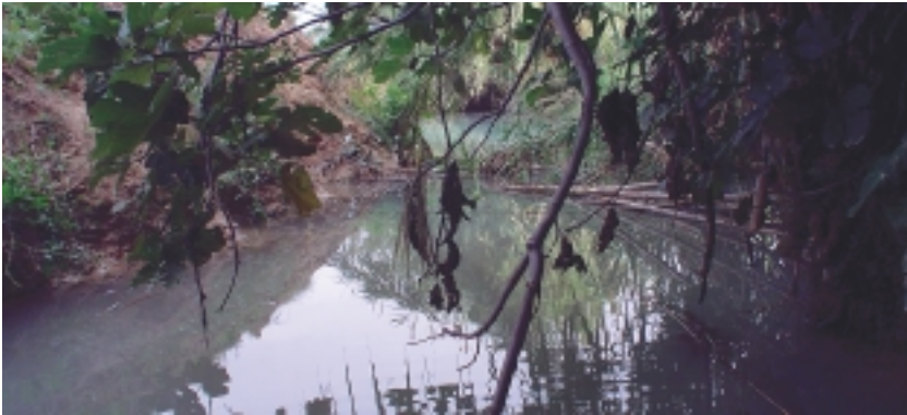
Aspecte actual de la Font de Barret.

ferro al mur (on se situava l'antiga covatxa) que aboca l'aigua al canalet que connecta amb la bassa. Esta ple de vegetació palustre, tant el canalet com la bassa. Troben la canya, senill, bova. Al fons del canalet observen els creixents i en la bassa algues filoses.