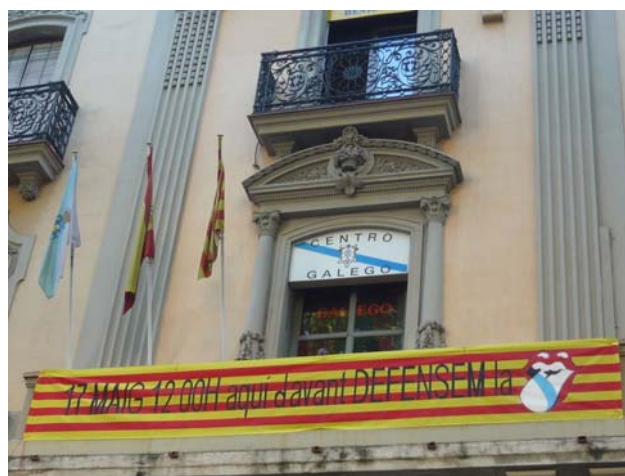
Balcón do Centro Galego de Barcelona engalanado co gallo do día das Letras Galegas

O Centro Galego de Barcelona fúndase no ano 1923, e segue hoxe activo na súa sede da Rambla dels Caputxins. Nel celébranse arestora moitísimos actos culturais como conferencias, representacións teatrais, presentacións de libros, cinefóruns, debates ou cursos de lingua e cultura galegas, e ten unha das bibliotecas galegas máis importantes do mundo.