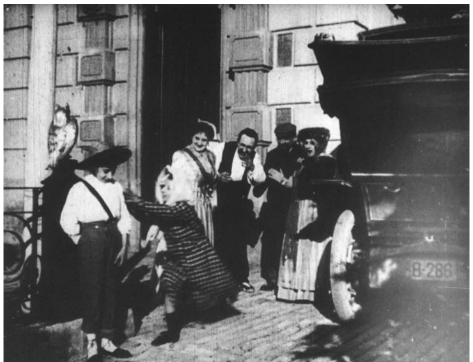
Amor que mata de Fructuós Gelabert (1909)

El següent cas concret pot fer llum sobre aquest punt. Gelabert féu quelcom més que intuir la sistemàtica del videocasset: inventà i construï un aparell de disc-film. Aprofitant l'existència de la fonografia, combinà la mecànica d'aquest procediment amb la del cinema i construï un aparell que funcionava amb discos de cel·luloide plens de petits fotogrames, en lloc del film clàssic. Aquesta invenció, emparada per una patent, que es conserva, representava unes possibilitats extraordinàries, i malgrat tot, per manca de mitjans pro-