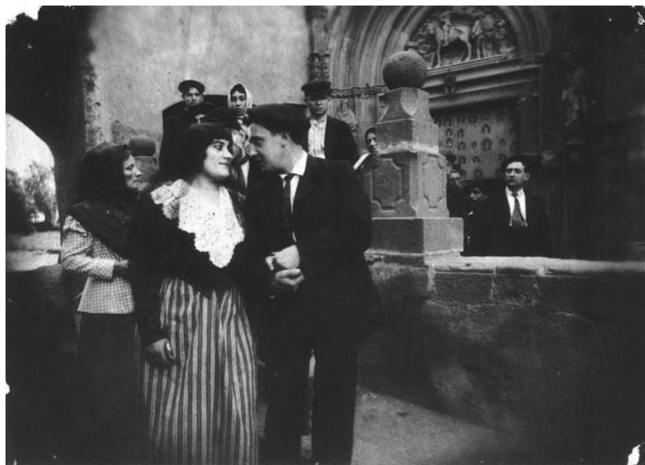
Lucha de corazones de Joan M. Codina (operador: Fructuós Gelabert)

Com a dada anecdòtica, caldria assenyalar que a partir del 1942 s'inicien les maniobres de Carlos Fernández Cuenca i altres escriptors cinematogràfics molt propers al règim per desplaçar Gelabert del lloc d'honor que ocupava en els textos cinematogràfics, on era considerat fins aleshores com el primer espanyol que havia rodat al país. Això no obstant, la manipulació realitzada per situar Gimeno al capdavant dels operadors nacio-