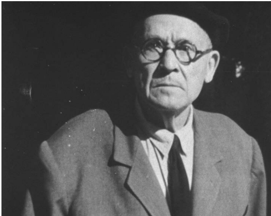
Fructuós Gelabert (1955)

nals no es va desenvolupar plenament fins a la defunció del gran pioner aragonès l'octubre del 1947. Gairebé immediatament, el 1948, Carlos Fernández Cuenca avençava la pel·lícula SALIDA DE MISA DE DOCE DEL PILAR DE ZARAGOZA a «la primavera o els inicis de l'estiu del 1897». Sense cap dada que donés suport a aquest joc de màgia, anticipava el film el just per situarlo davant d'on Gelabert havia datat la seva RIÑA EN UN CAFÉ. En una fase posterior, Cabero, el 1949, i d'altres entre què –inevitablement!– també es trobava el senyor Fernández Cuenca, van establir definitivament la data en la ja clàssica del 12 d'octubre del 1896, és a dir tres anys abans de la data real del seu rodatge: el 5 de novembre del 1899. D'aquesta manera, Gelabert va quedar en tots els textos com «el fundador de la indústria cinematogràfica espanyola» i «el primer espanyol que va rodar una pel·lícula de ficció» però no com «el primer espanyol que va rodar una pel·lícula», uns aspectes que continuen recollint-se en tots els compendis d'historiografia cinematogràfica espanyola.