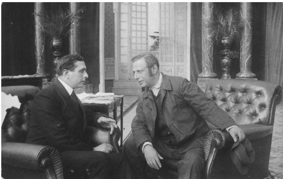
El sino manda de Fructuós Gelabert (també coneguda com El destino manda )