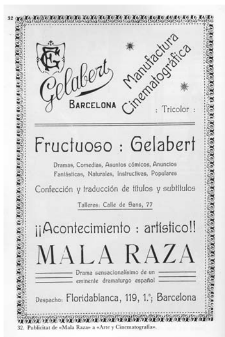
Publicitat de l'època del film Mala raza de Fructuós Gelabert (1912)

pis o d'un finançament oportú, no passà del nivell experimental.