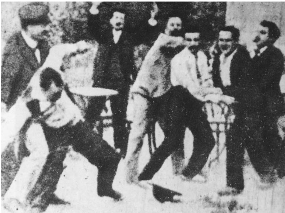
Riña en un café de Fructuós Gelabert (únic fotograma que es conserva de la versió de 1897)

resultats. Especialment en el dibuix, obtingué èxits i desenvolupà afeccions que després no abandonaria. Ben al contrari, entre els seus treballs d'escola i els apunts del natural, fets per afeció, es nota una millora. Una sèrie de dibuixos de racons de Barcelona, fets per ell en colors, foren transformats en postals impreses. I tampoc no hem d'oblidar que, ja madur, durant la guerra civil, en un dels seus períodes més difícils, es dedicà a pintar amb un estil ingenuista no mancat d'encert.