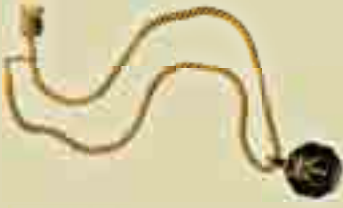
"LA MERCÈ MEDALLA D'OR DE LA CIUTAT"