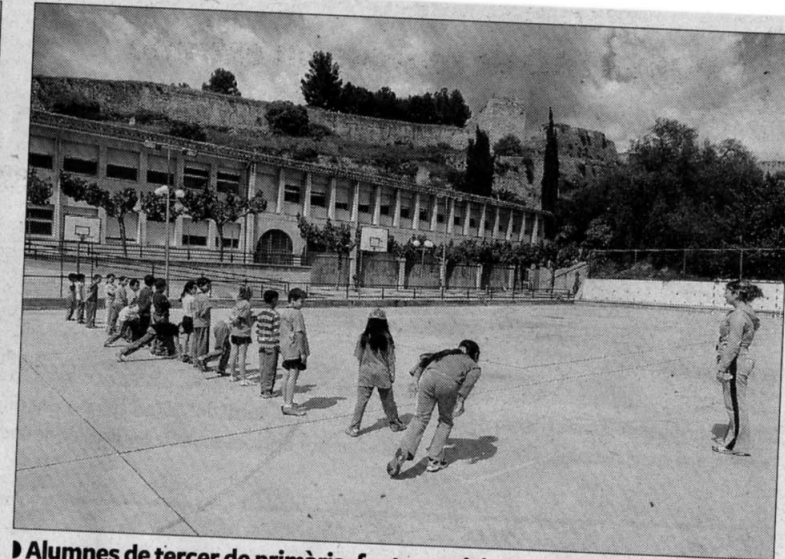
► Alumnes de tercer de primària, fent exercici ahir a la tarda al pati de l'escola.