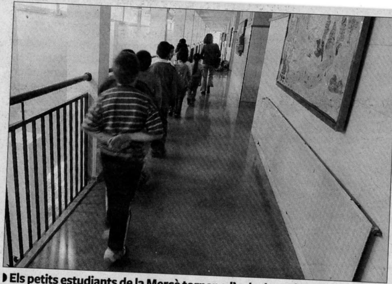
► Els petits estudiants de la Mercè tornen a l'aula després d'una activitat.