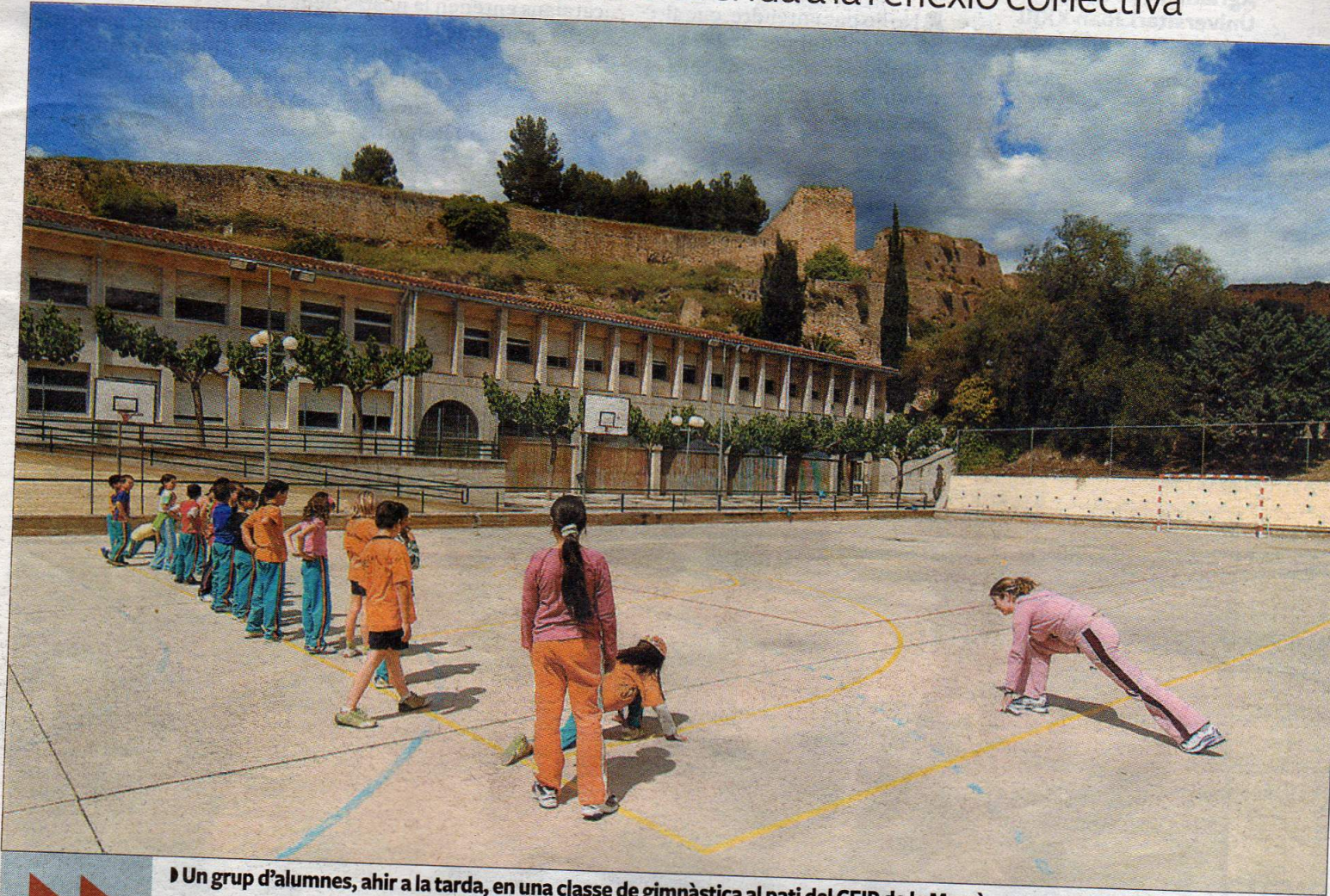
► Un grup d'alumnes, ahir a la tarda, en una classe de gimnàstica al pati del CEIP de la Mercè.