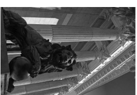
L'avantprojecte ja ha estat aprovat pel Congrés dels Diputats.

Això vol dir que els conductors, que disposaran d'un crèdit inicial de 12 punts, podran perdre el carnet en un sol dia per l'acumulació de dues de les infraccions molt greus sancionades amb la pèrdua de 6 punts cadascuna. Així ho va afirmar ahir el ministre José Antonio