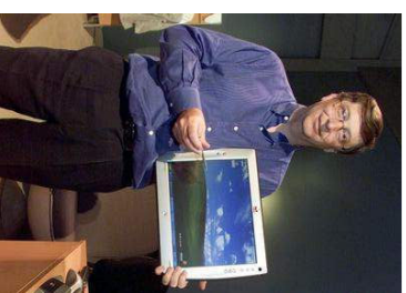
Bill Gates, l'home més ric del món.

NOVA YORK - El rànquing de Forbes, tradicional mitrador de la riquesa personal, torna a estar encapçalat per Bill Gates . El president de Microsoft