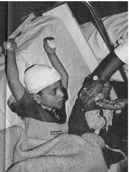
Entre les víctimes dels atemptats també cal comptabilitzar nens ferits.

Rumsfeld , no ha tingut més remei que declarar que els serveis d'intel·ligència i del Pentàgon no havien pensat que la rebel·lió es perllongués durant tant de temps. Tot i això va matisar que els nord-americans poden establir Iraq en un termini de dos anys.