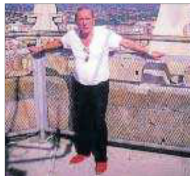
Et desitjo tot i res: tot el que et faci feliç i res que et faci patir.