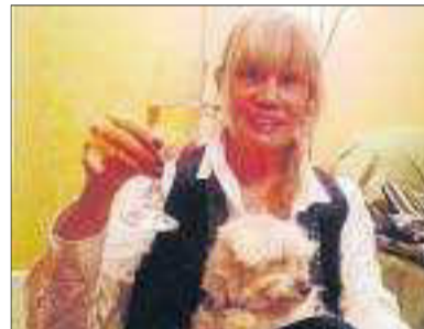
Brindem amb l'excel·lent amiga i millor persona pel seu aniversari. Felicitats!