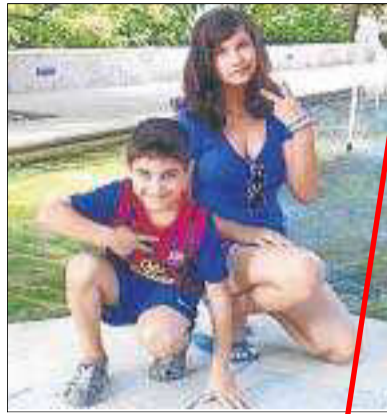
Feliç aniversari, Andra . Donem les gràcies per tindre una filla com tu!