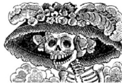
JOSÉ GUADALUPE POSADA (1852-1913)