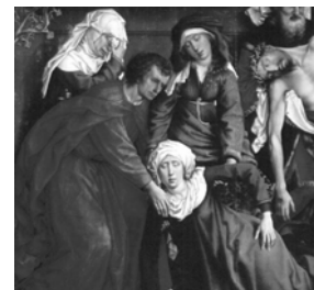
Rogier Van der Weyden 1400-1464

Entenem com a dol o processos de dol al conjunt d'emocions, representacions mentals i conductes vinculades amb la pèrdua afectiva, la frustració o el dolor