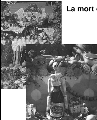
Día de muertos en Chiapas