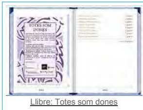
Llibre: Totes som dones

S'apropa el 8 de març, dia de la dona, però a Sant Feliu de Guíxols ja fa molts dies que estem treballant en xarxa temes de coeducació. Per a vertebrar l'esmentada feina l'assessora LIC (dels serveis educatius), el SIAD (servei d'informació i atenció a la dona), la biblioteca pública municipal i diferents entitats del poble es reuneixen, ja al mes de setembre, i decideixen el tema que es treballarà cada any a nivell col·lectiu. Després es passa la proposta a les escoles, instituts i entitats del municipi, i en el mes de febrer es recullen els treballs, s'exposen a la biblioteca i es fa un llibre virtual per a que tothom pugui gaudir de la mostra sense sortir de casa. Per últim els bibliotecaris fan visites guiades de l'exposició i expliquen un conte acord amb el tema al final del recorregut.