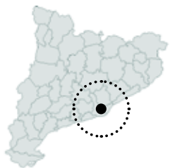
Esplugues de Llobregat Baix Llobregat