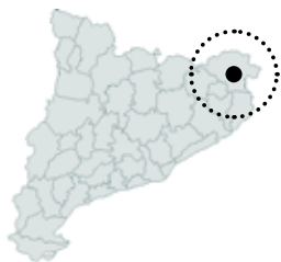
Figueres Alt Empordà