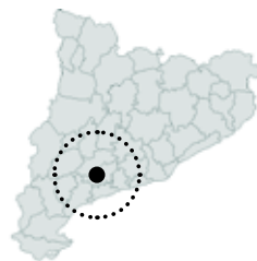
Valls Alt Camp