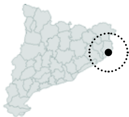
Palafrugell Baix Empordà