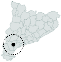
El Masroig El Priorat