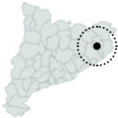
Sarrià de Ter Gironès