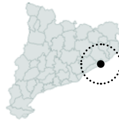
Malgrat de Mar Maresme