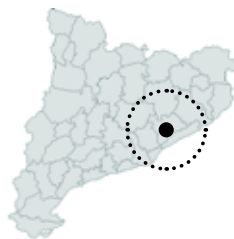
La Roca del Vallès Vallès Oriental