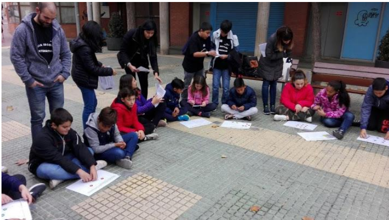
Més de 10 anys de Mates al Carrer , el projecte participatiu amb les escoles de primària de l'entorn.