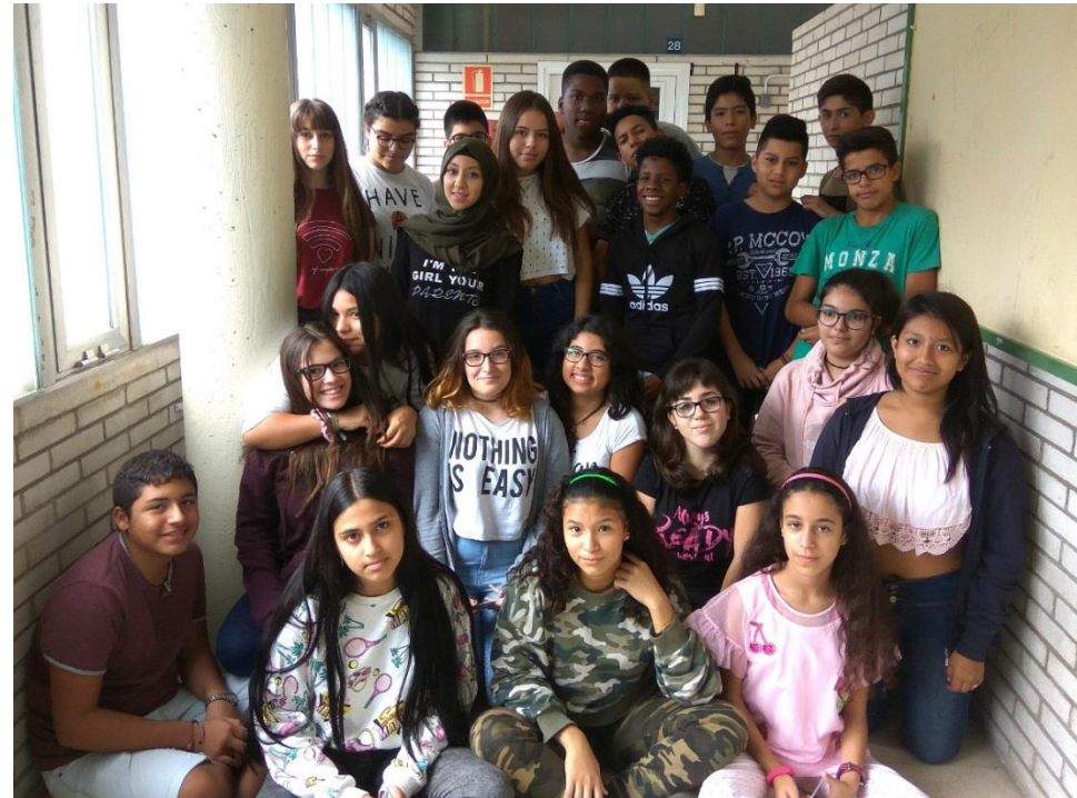
Coneixement personal i projecte professional