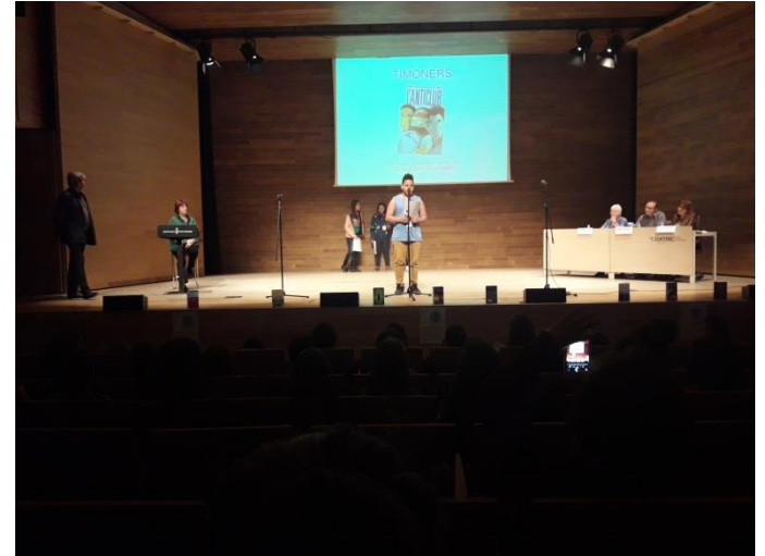
Certamen del Lectura en veu alta.