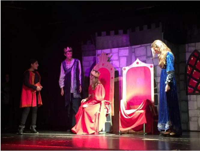
Teatre en anglès. 1r Premi del Trinity College.