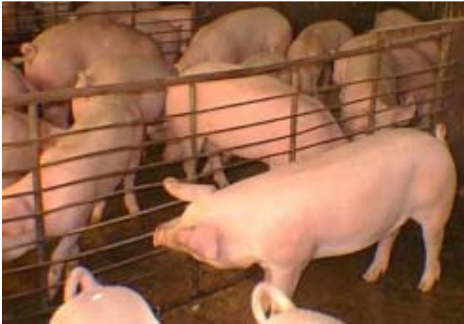
Granja de porcs