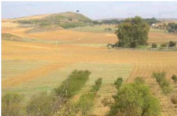
Camp de secà

Respecte a la ramaderia, la comarca del Segrià juntament amb el Solsonés són les dues comarques amb més producció ramadera de tot Catalunya. El bestiar porcí és el més important, li segueix el bestiar boví que es presenta en explotacions productores de llet i granges de vedells.