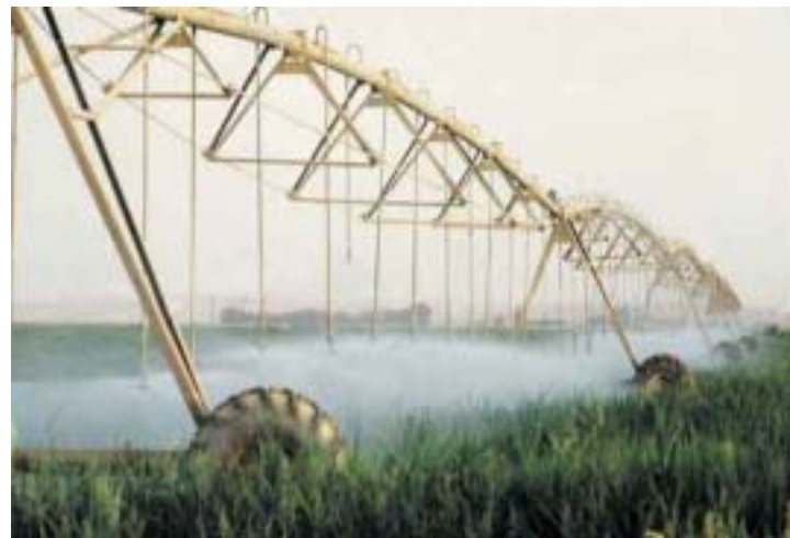
Camp de regadiu