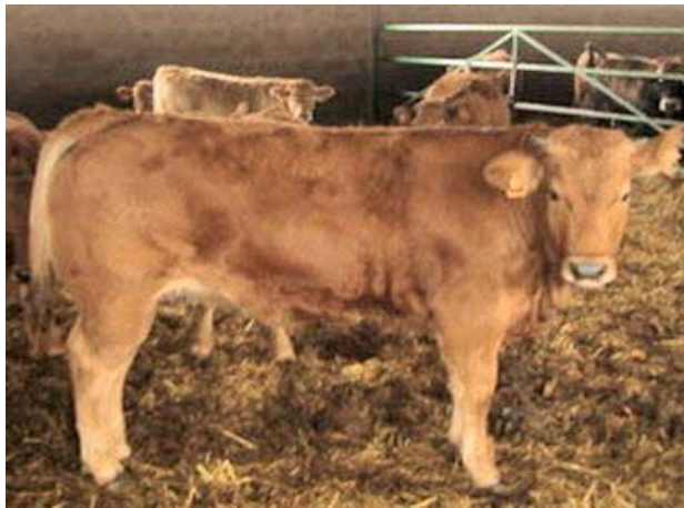
Granja de vedells