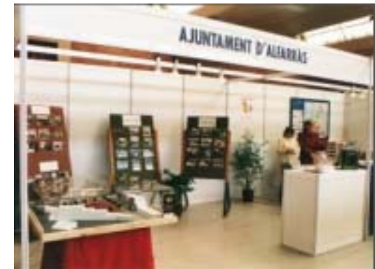
Fira del préssec (Alfarràs)