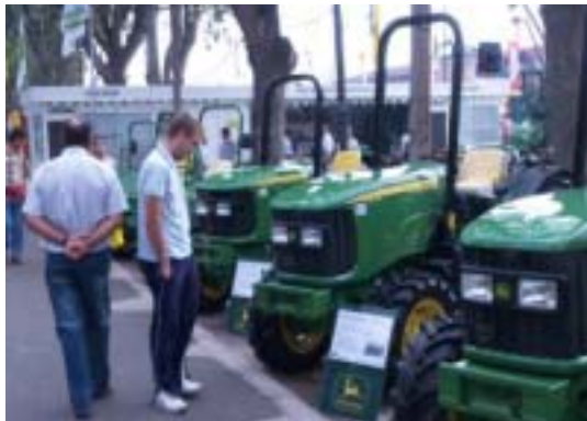
Fira de Sant Miquel