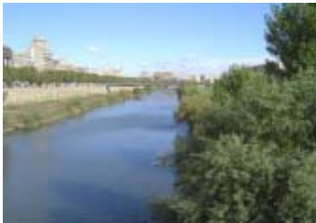
El riu Segre a Lleida ciutat