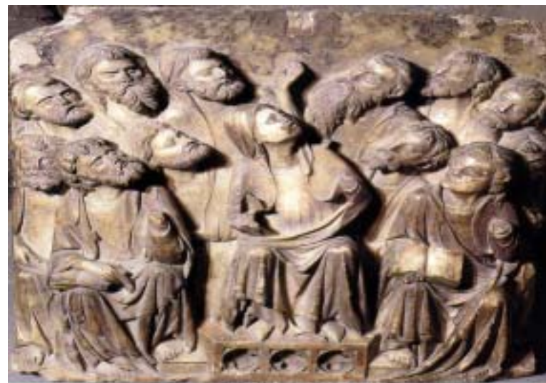
Pentecosta. Bartomeu Robio