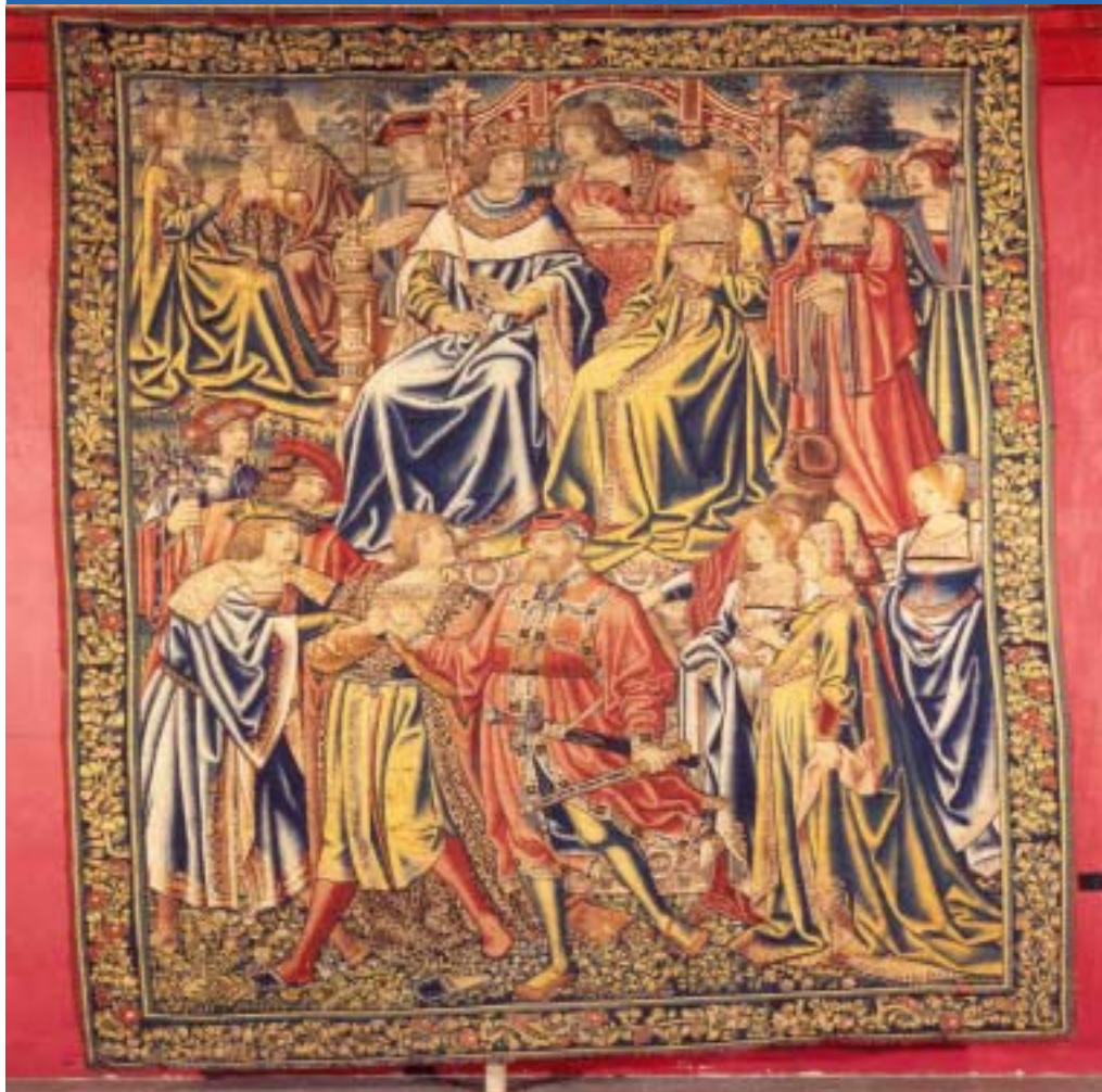
Tapís Jason y Medea de la Sèrie de les «Metamorfosis»

El fons del museu es nodreix de la col·lecció diocesana, de l'antic Museu Diocesà de Lleida – com el joc d'escacs de la col·legiata de Sant Pere d'Àger o les col·leccions de pintura i escultura gòtiques– i de la col·lecció capitular de la catedral de Lleida –que inclou l'orfebreria del tresor catedralici i els quinze tapissos flamencs del segle XVI procedents de la Seu Vella. A la nova seu del museu, avui en obres, s'hi incorporarà la col·lecció arqueològica i numismàtica de l'Institut d'Estudis Ilerdencs.