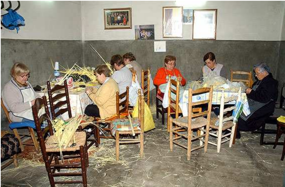
Senyores treballant les palmes

( http://www.revistacambrils.com/imatges/2009/4/palmes.jpg )