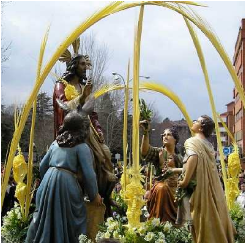
Processó de Setmana Santa

( http://www.revistacambrils.com/imatges/2009/4/palmes.jpg )