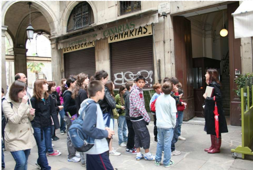
Primer Club de Lectura: Ruta Literària per Barcelona