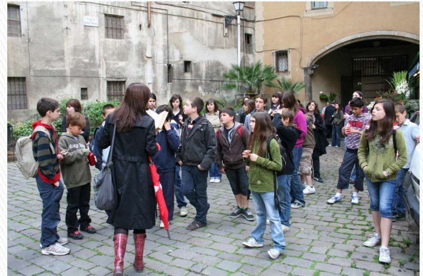
Primer Club de Lectura: Ruta l'Ombra del Vent