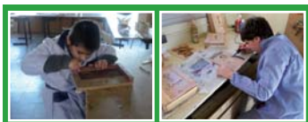
Tècniques d'impressió: linogavat

L'important no és pas un gran coneixement dels tallers específics, sinó l'adquisició de més autonomia de treball, i aprendre a valorar la satisfacció fruit de la feina ben feta, tant a nivell individual com respectant les tasques realitzades pels companys.