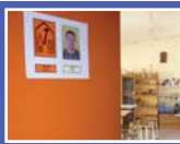
Accessibilitat en els diferents entorns escolars

El nostre objectiu és treballar la comunicació perquè el/a alumne/a pugui interactuar amb el seu entorn, procurant que la seva comunicació, llenguatge i parla sigui el més satisfactori i adequat, tant per ell/a, com per les persones que l'envolten (la família, l'escola, els companys, el barri...); per això, el nostre treball no incideix únicament en l'alumne/a, sinó també, en els agents que interactuen amb aquest, amb la finalitat que els seus aprenentatges en l'àmbit de la comunicació i llenguatge, esdevinguin significatius i funcionals.