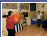
Treball corporal per millorar l'emissió de veu