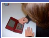
Treball amb sistemes augmentatius i/o alternatius de comunicació: objecte tangible, foto, pictograma, signe manual, eines informàtiques...