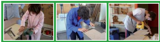
Taller de fusteria