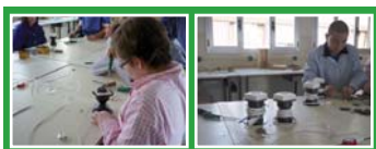
Tallers d'electricitat 220v