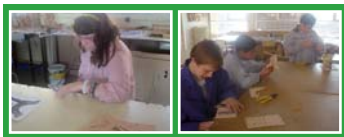
Taller de marqueteria