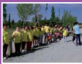
Xalost i CEE Bellapart Jornades Esportives

Participar Treball cooperatiu Cooperar Competents Organitzar Compartir Conèixer Decidir Diversitat Inclusió social