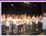
A Tempo i CEE Bellapart Coral Cors amb cor