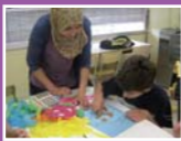
IES agustí Serra teatre i taller de màscares

S'han promogut activitats compartides amb altres escoles i instituts, on els alumnes no només gaudeixen d'una activitat engrescadora en un entorn normalitzat sinó que aquestes activitats ens permeten formar nois i noies competents a nivell social, fomentant així la inclusió social.