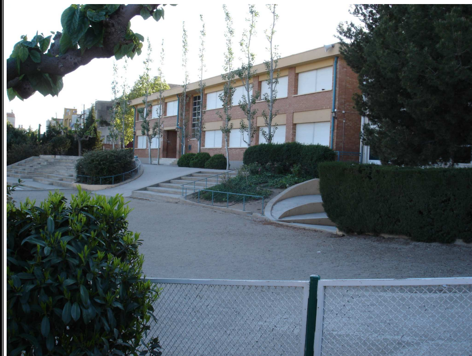
escola Gil Cristià