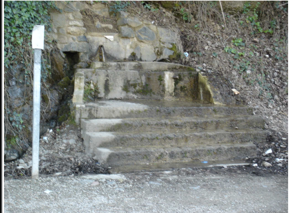
gossos, font dels