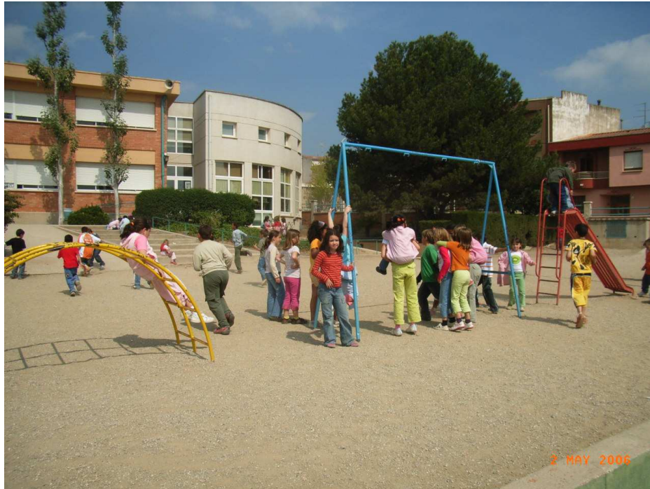
xiquets i xiquetes

xop - és un arbre d’ombra que hi ha en alguns carrers del nostre poble.