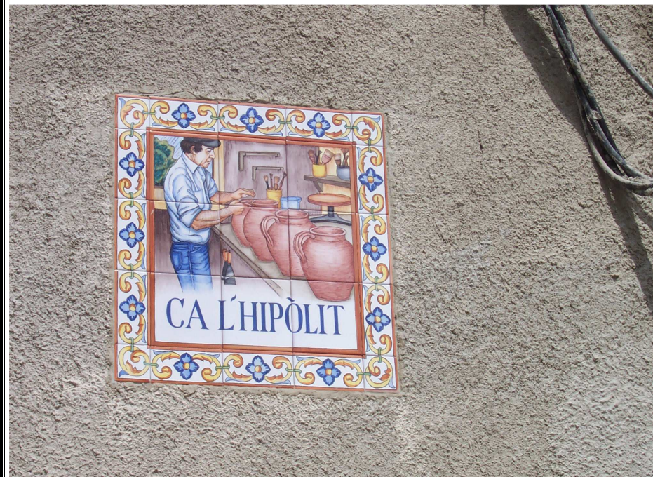
Hipòlit, ca l'