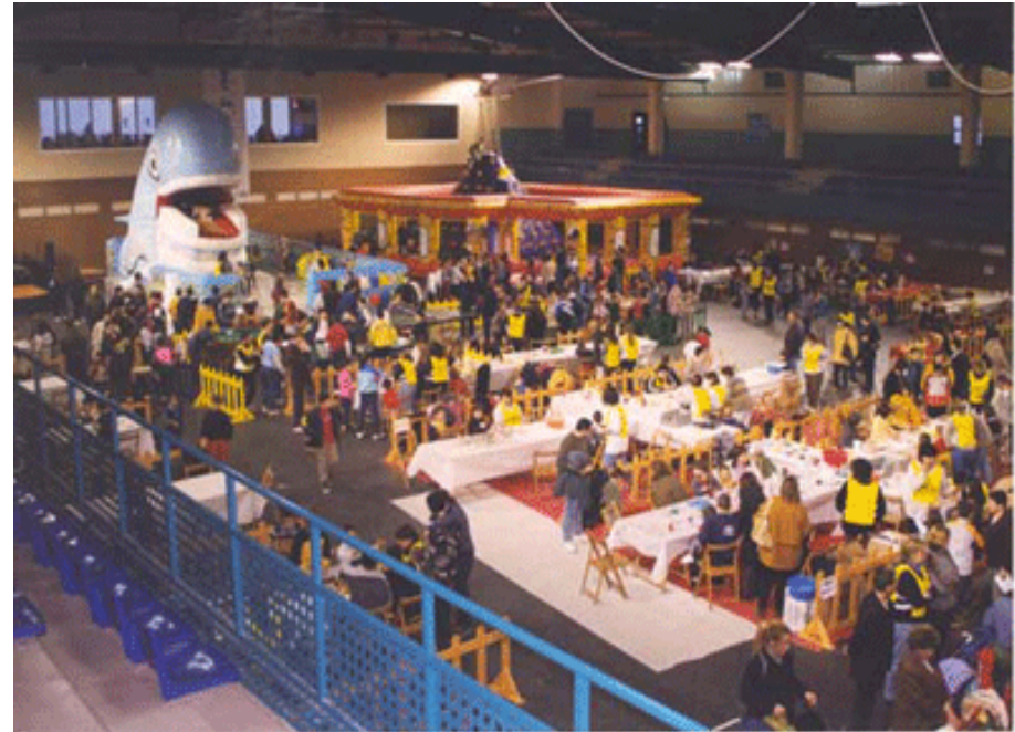
Nadal, parc de