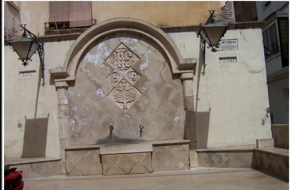
font de mitja vila