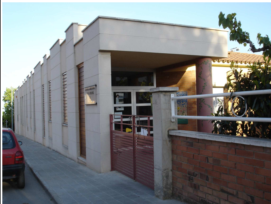
escola bressol municipal

escola Gil Cristià – escola pública, on hi van els alumnes de 3 a 12 anys. Aquest nom el porta des que està situada al carrer Pare Crusats.