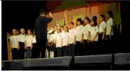
Concert de la coral