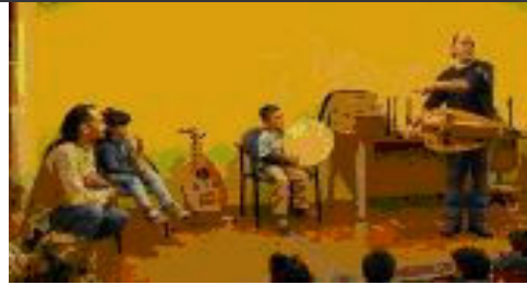
Audicions en viu