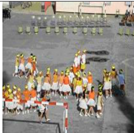
H C Andersen