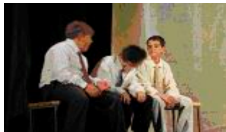
Obra de teatre: Tereseta que baixava les escales . Salvador Espriu