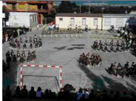
El Flautista d'Hamelin