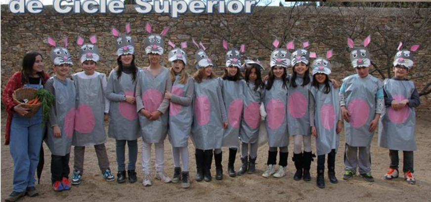
Els conills de Cicle Superior