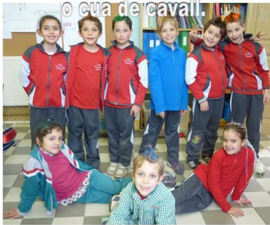
o cua de cavall.