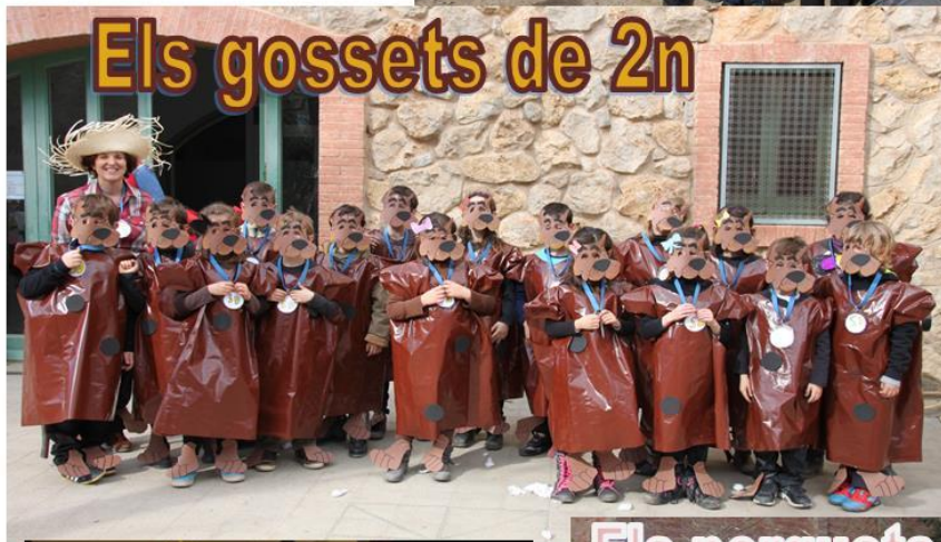
Els gossets de 2n