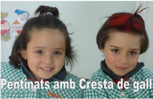
Pentinats amb Cresta de gall

El Rei Carnestoltes, com és habitual també va manar una sèrie d'ordres que durant aquella setmana, alumnes i professors vam complir.