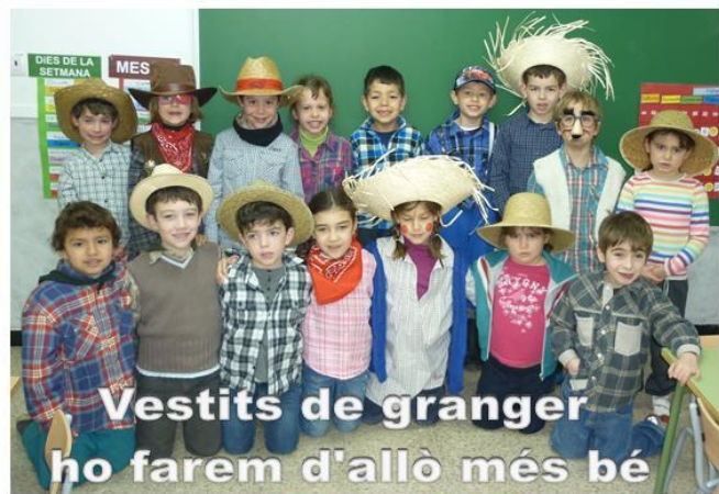
Vestits de granger ho farem d'allò més bé