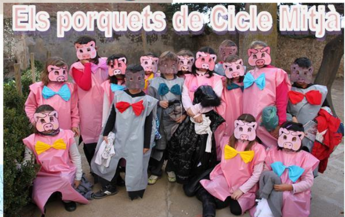
Els porquets de Cicle Mitjà