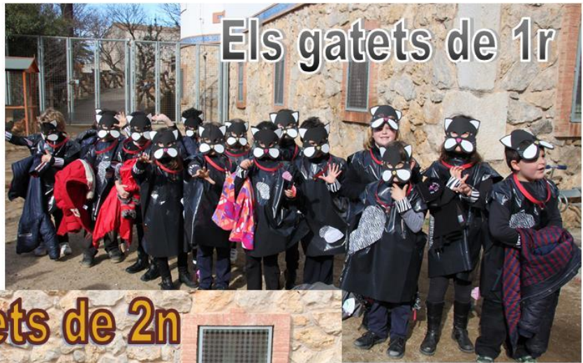
Els gatets de 1r