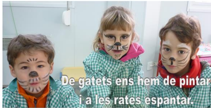
De gatets ens hem de pintar i a les rates espantar.