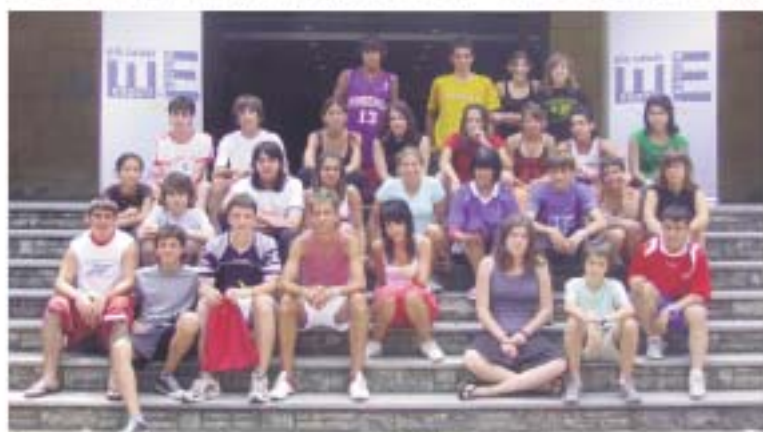
Curs de Dinamitzadors/es d'Esport a l'Escola - Estiu 2006 - 3r torn - Grup 5