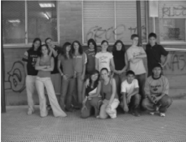
Grup de la revista de 1r trimestre: