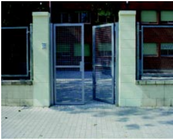
Obres a l'institut