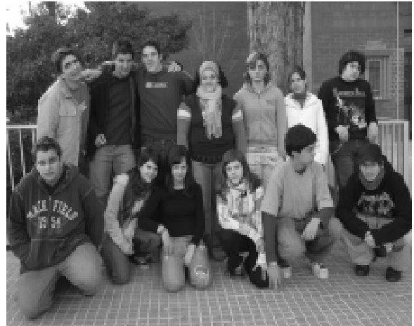
Grup de la revista de 2n trimestre: