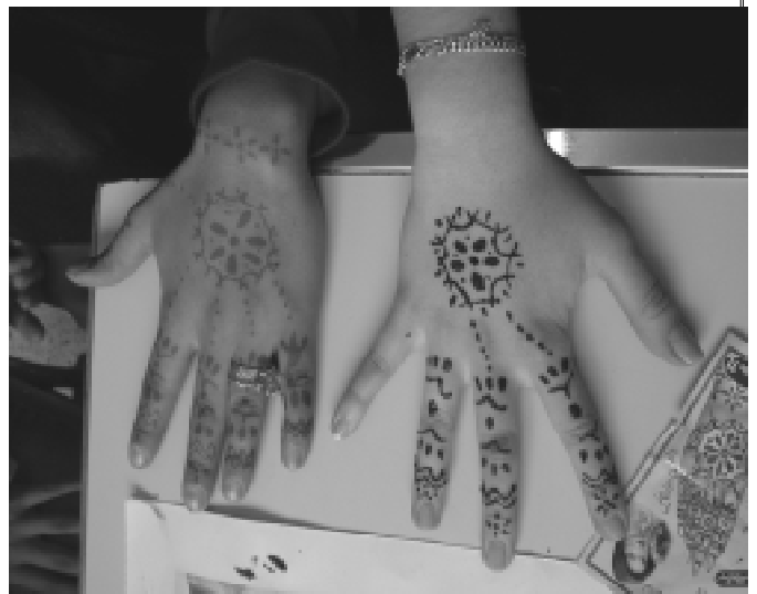
Taller de henna