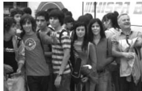
••• ELS ALUMNES DE 4T D'ESO A LA SORTIDA DE L'AUTOCAR QUE ELS VA PORTAR A GIRONA.

Els van portar pel casc antic: els van explicar perquè les cases eren de colors, van haver de pujar 90 esglaons per arribar a la catedral on els van explicar la història de la lleona i de les mosques. Els van ensenyar un tapís de la creació, van visitar el museu i, finalment, van pujar una escala per acabar la visita en un mirador. Després de dues hores d'explicació les monitores van dir adéu als alumnes i als professors comentant