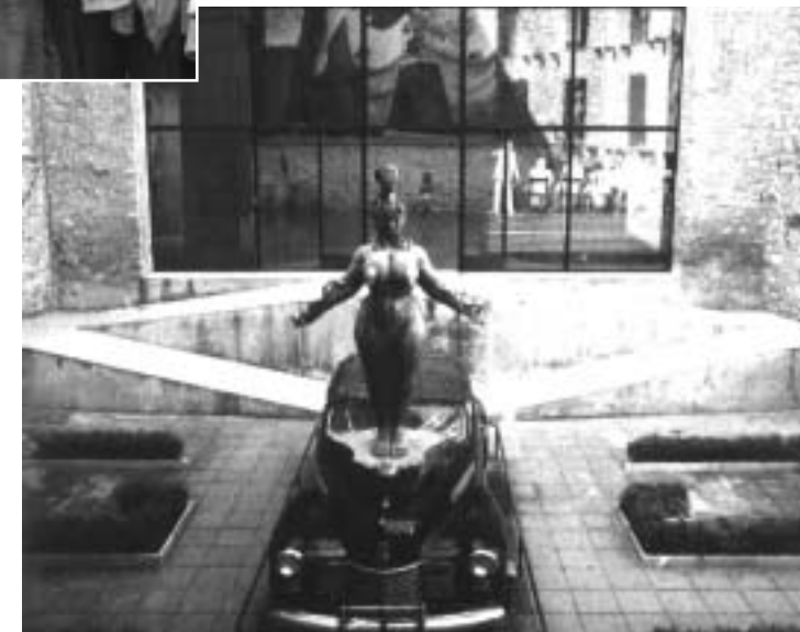
••• SALA PRINCIPAL DEL TEATRE MUSEU DE DALÍ, A FIGUERES, ON ES POT VEURE L'AUTOMÒVIL PLUJÓS.

Els van portar pel casc antic: els van explicar perquè les cases eren de colors, van haver de pujar 90 esglaons per arribar a la catedral on els van explicar la història de la lleona i de les mosques. Els van ensenyar un tapís de la creació, van visitar el museu i, finalment, van pujar una escala per acabar la visita en un mirador. Després de dues hores d'explicació les monitores van dir adéu als alumnes i als professors comentant