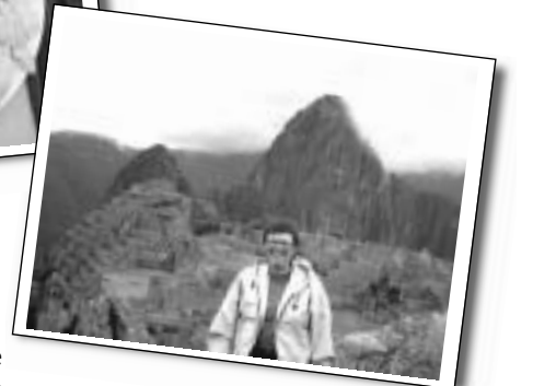
••• LA MONTSE AL DESERT, A PERSÉPOLIS I AL MATXU PITXU. AL COSTAT, UN CUY, UNA POBRA BESTIOLA QUE ES VA HAVER DE MENJAR.

«L'ÚLTIM VIATGE QUE ES FA SEMPRE ÉS EL MILLOR.»