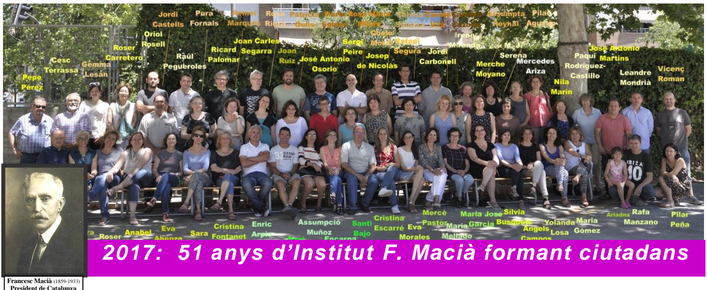
Francesc Macià (1859-1933) President de Catalunya

Ens enorgulлим de l'estreta i fructífera col·laboració mútua; per això organitzem activitats conjuntament. A més, en el Consell Escolar (màxim òrgan de consulta del centre), hi ha sintonia i afinitat, la qual cosa es reflecteix en els bons resultats acadèmics, i el benestar en el centre. L'AMPA ofereix diversos serveis; organitza la compra social de llibres, o a preus avantatjosos. Organitza el sopar de Nadal de pares, i patrocina les festes de final de curs. Junts fem un sentit homenatge als "avis cangurs".