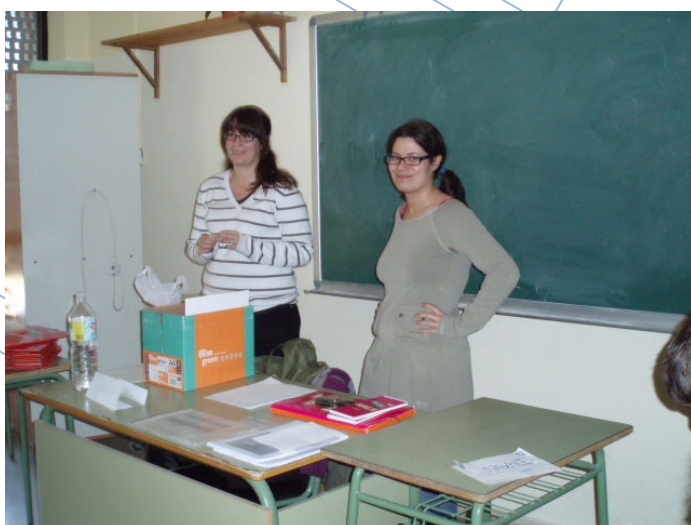
Monitores del taller