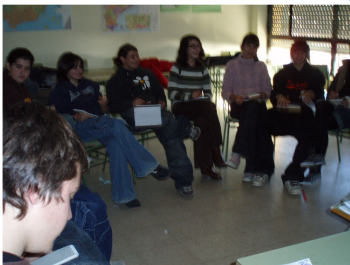
3er eso B