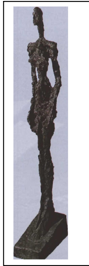
(1428) Giacometti .Dona de Venècia (1956). L'obra de Giacometti representa la tridimensionalitat de l'angoixa existencial de l'informalisme a través de superfícies rugoses i de les formes allargades.

L'escultura de la segona meitat del segle xx és molt rica en plantejaments (1428, 1470, 1471), però no hi ha cap escola o moviment artístic que prengui com a model l'original obra de Calder. La influència de l'escultor nord-americà va ser decisiva per mostrar una visió diferent de l'escultura i descobrir que és possible entrar en contradicció amb els elements bàsics i tradicionals del llenguatge artístic. Els crítics d'art han arribat a la conclusió que, amb l'obra de Calder, el factor estàtic de l'escultura ha estat superat. Sense cap mena de dubte, les seves creacions han estat un referent de la integració de l'escultura dintre del paisatge, que aquesta transforma i envolta amb el moviment. L'estudi del buit i el ple dintre del corrent abstracte escultòric fou seguit per artistes com Chillida (0118, 1429); i la integració espacial de l'escultura, per diversos autors del moviment land art com, per exemple, Smithson (1422).